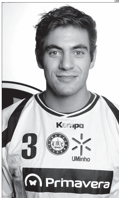
Jogadores do ABC/UMinho querem vencer mais um dérbi