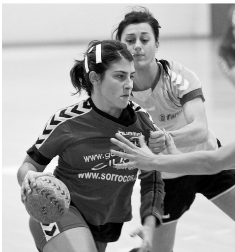
GIZELLE não vai poder jogar contra às suíças devido a lesão

Para André Afra, o jogo de sábado é "decisivo" no sentido de aquilatar o potencial da equipa adversária, numa com-