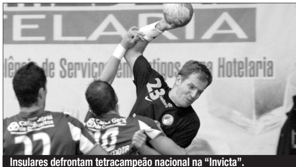
Insulares defrontam tetracampeão nacional na "Invicta".

Jogo grande esta tarde (a partir das 18h) no Dragão Caixa, na "Invicta". Frente-a-frente FC Porto (campeão nacional) e Madeira SAD ("vice"), em situações diferentes na tabela. Os portistas são 2.ºs classificados (nove vitórias e uma derrota) e defrontam os madeirenses, 6.ºs da classificação (seis triunfos e quatro desaires).