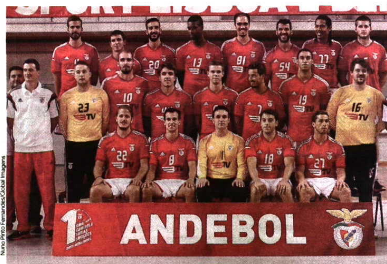
Plantel do Benfica para a nova temporada apresentou-se com dois reforços