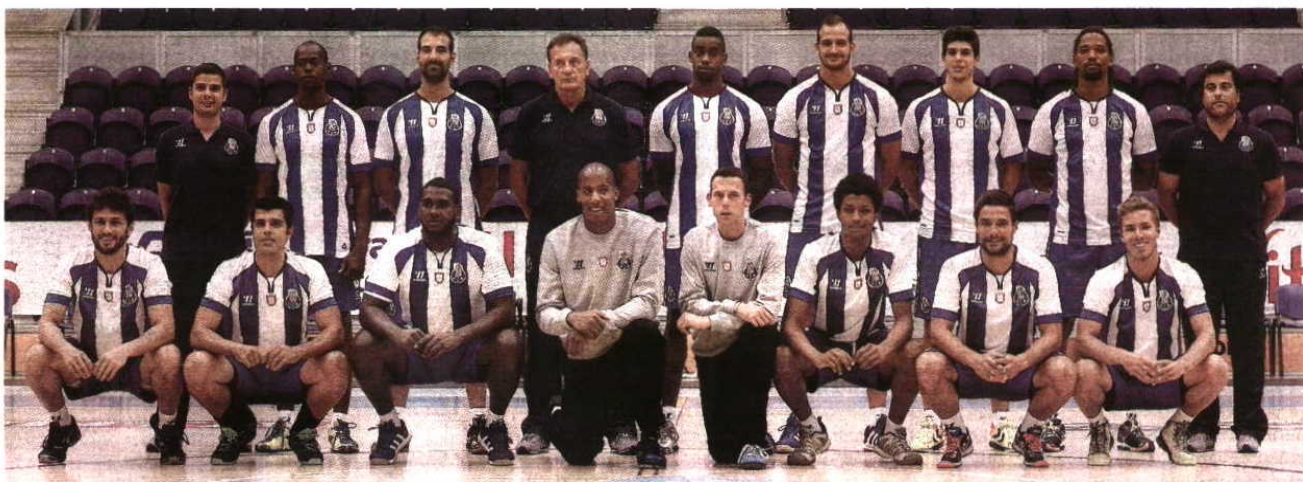
Ivan Del Val / Global Images

ANDEBOL FC Porto apresentou o plantel para a nova época, tendo como objetivos voltar a ser campeão nacional, entrar na fase de grupos da Liga dos Campeões e vencer a Taça e a Supertaça