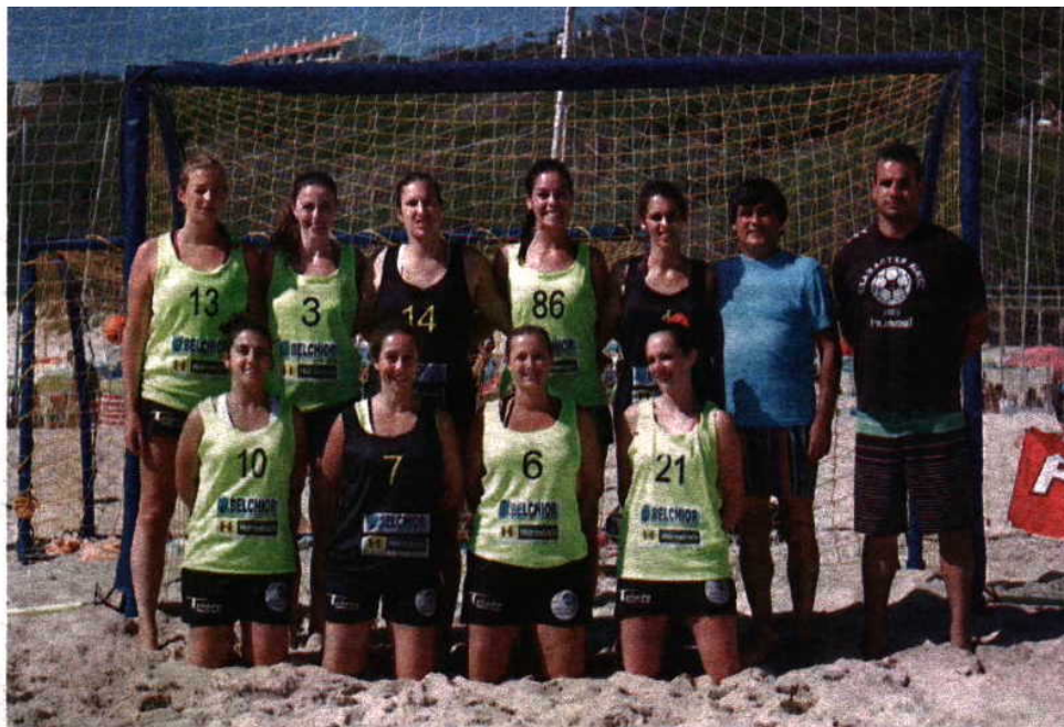
100 Ondas, em femininos, e Raccoons d'Areia, em masculinos, venceram circuito regional