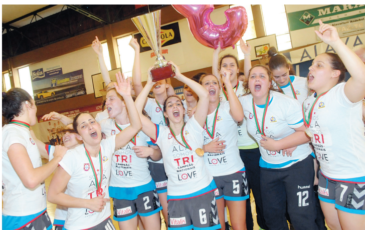
Alavarium é a actual tri-campeã nacional em seniores femininos