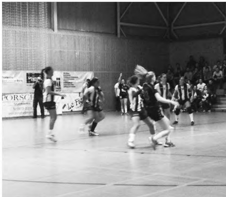
Madeirenses surpreenderam na Áustria

Em termos nacionais, o Marítimo não foi feliz na estreia no campeonato nacional da II Divisão,