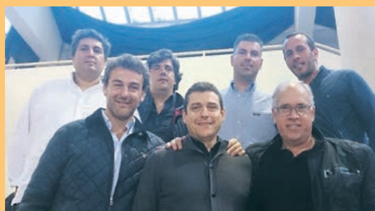
Campeões de outras épocas assistiram ao ABC/UMinho - Dínamo de Bucareste

SETE ALTERNATIVO na bancada VIP do Parque de Exposições de Braga havia equipas de andebol alternativas às que estiveram em campo, como esta que o Correio do Minho documenta na imagem.