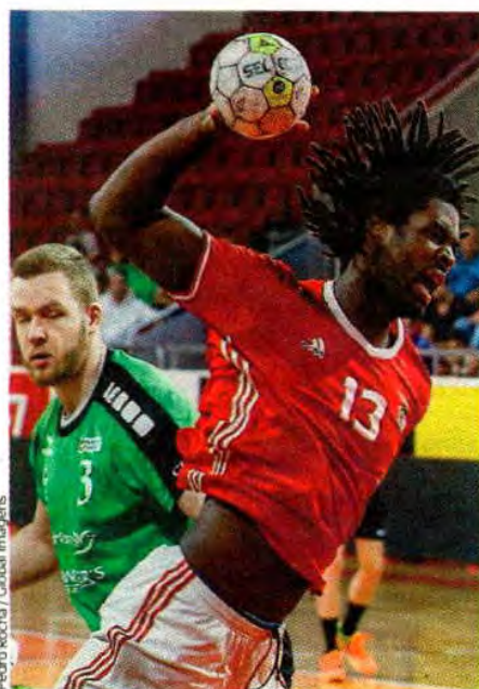
Pedro Rocha / Global Images