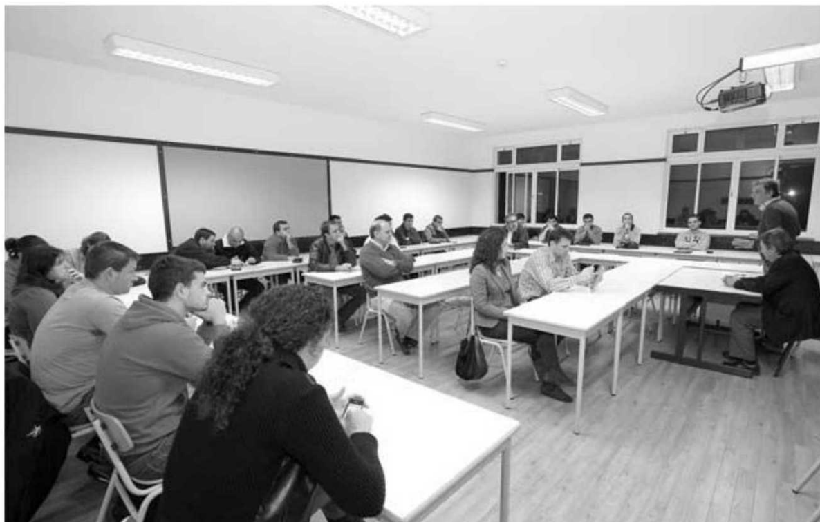
Treinadores voltam a reunir-se em mais uma acção de formação.