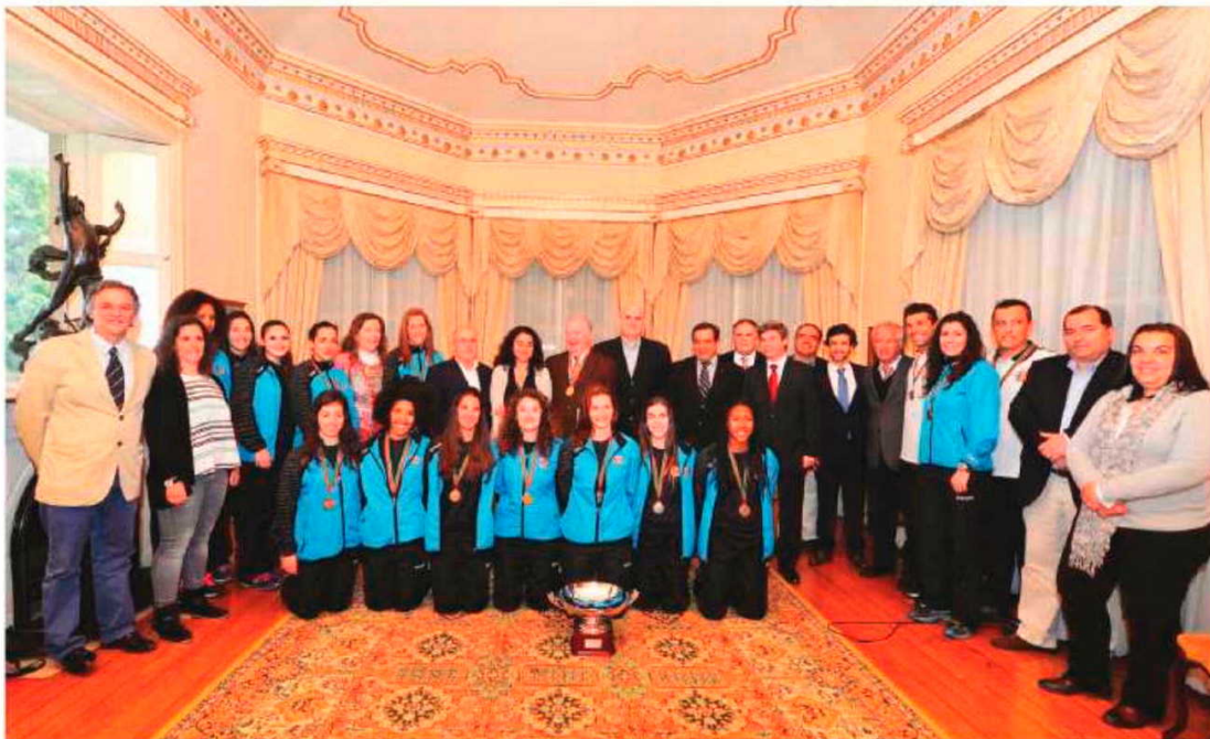
Jardim recebeu ontem a equipa feminina do Madeira SAD, que conquistou a Taça de Portugal.

Já nos masculinos, o Madeira Andebol SAD inicia esta noite, 21