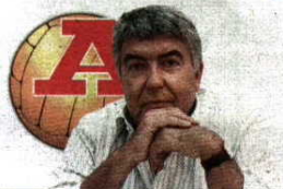
por VÍTOR SERPA

Os clubes já há muito que deixaram de ser o pilar do desenvolvimento desportivo em Portugal. Ninguém os substituiu. A política desportiva é zero!