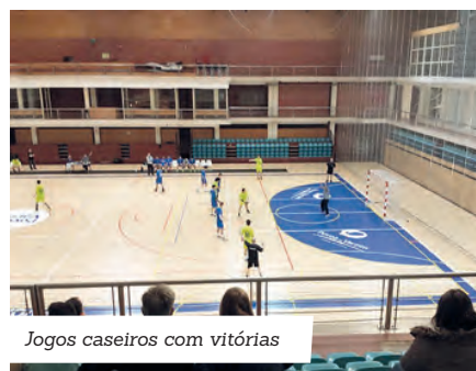
Jogos caseiros com vitórias

Decorreram no passado fim de semana os jogos de andebol dos escalões de Juvenis, Juniores e Infantis no Pavilhão Municipal da Póvoa de Varzim. Em destaque estiveram os escalões juvenis (Póvoa Andebol - Académico FC, 20-17) e também os juniores (Póvoa Andebol - C P Natação 24-20). As suas equipas viraram o marcador depois do intervalo, conseguindo a vitória nos dois jogos. Já os infantis perderam frente ao FC Infesta, por 28x33, num jogo que segundo os dirigentes do clube poveiro teve "alguma polémica à mistura".