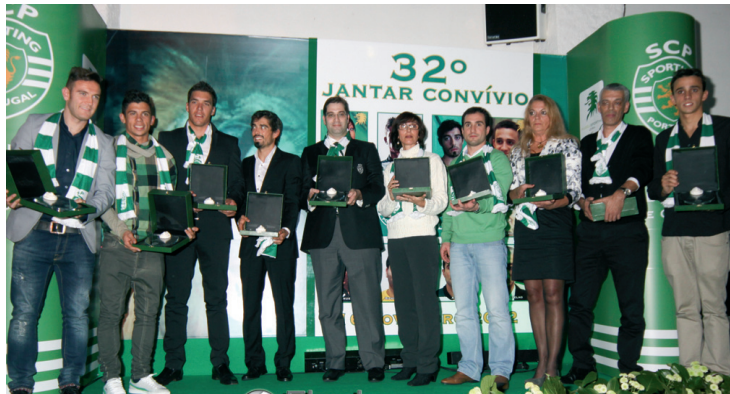
RUGIDOS Foram dez as personalidades homenageadas pelo Sporting com a atribuição do 'Rugido de Leão'

A surpresa maior foi a mensagem telefónica desde Madrid de Cristiano Ronaldo que se sentiu muito honrado por ter sido convidado a prestar algumas declarações sobre a festa. "Espero que a nossa escola do Sporting volte a ser o que era, porque acredito que mais cedo do que se espera a equipa vai dar o seu melhor e vai passar esta fase menos boa. Com este novo treinador e com o plantel muito bom do Sporting, tenho muita fé e muita esperança em