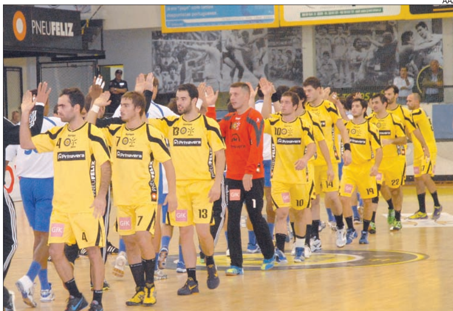
ABC recebe hoje o líder do campeonato

Importa ainda lembrar que, de acordo com o regulamento, as equipas do Andebol 1 que jogarem com clubes de escalão inferior, jogarão na condição