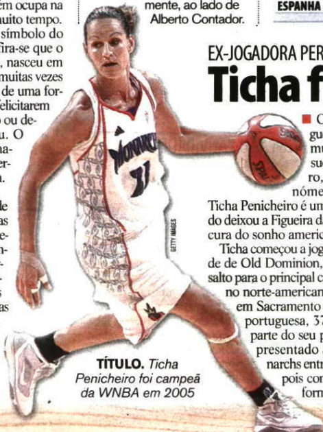
TÍTULO. Ticha Penicheiro foi campeã da WNBA em 2005

Nota: Apenas portugueses a competir nas divisões principais