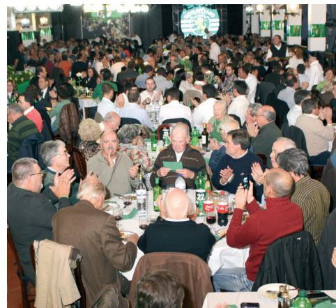
SPORTINGUISTAS encheram o restaurante da Aldeia de Santo Antão