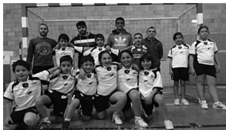
A equipa de minis

No passado dia 10 de novembro, a equipa de minis da escolinha de andebol deslocou-se a S. P do Sul para realizar mais um jogo a contar para o campeonato regional de minis da Associação de Andebol de Viseu. O resultado desfavorável de 12-5 foi o espelho do que aconteceu durante todo o jogo. Foi uma tarde de pouca inspiração e concentração da parte dos atletas de S. Miguel do Mato. Poucas vezes conseguiram colocar em prática o que treinam durante a semana assim como o que de bom têm feito nos jogos anteriores. Foi certamente uma tarde de pouco alento para os nossos jovens atletas. No entanto, o espírito de entajuda e fair-play foram notórios durante todo o tempo de jogo, o que é muito importante no seu percurso, quer no âmbito desportivo quer na formação pessoal.