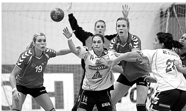
Col. de Gaia volta a brilhar no andebol europeu

acredito que vai ser um duelo muito complicado", aponta. A presença de quatro estrangeiras no plantel das helénicas é um dos fa-