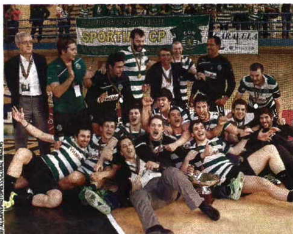
Taça de Portugal Sporting é o atual detentor do troféu