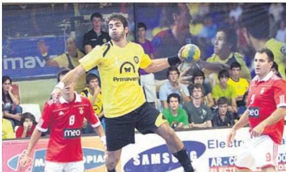
ABC recebe hoje o Benfica, no pavilhão universitário de Gualtar

jogo no pavilhão universitário de Gualtar vai no sentido de continuarmos a aproximação do ABC aos mais jovens e à UM. Queremos que o público académico venha apoiar o Académico”, afirmou o dirigente do ABC, anunciando que o jogo tem entradas gratuitas, precisamente, para toda a comunidade da academia minhota, desde estudantes a docentes.