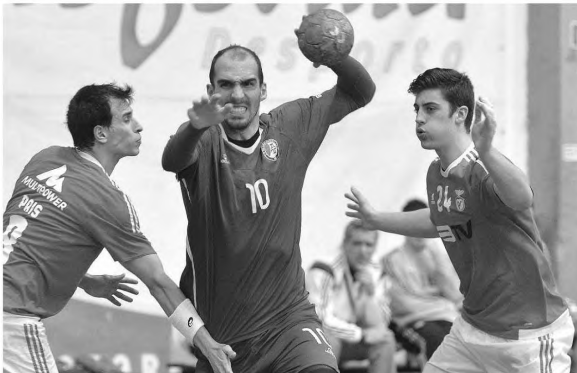
Madeira SAD vai tentar inverter a eliminatória com o Benfica no Pavilhão da Luz.

Já para a II Divisão, em masculinos, fase regular, zona Norte, o Marítimo recebe esta tarde às 15 horas a Sanjoanense.