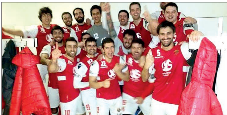
Equipamentos de lazer da Zona das Camélias

Na classificação geral, o Arsenal da Devesa segue na frente, com 53 pontos, mais um que o Santo Tirso. Seguem-se S. Mamede (48), Marítimo (44), S. Ber-