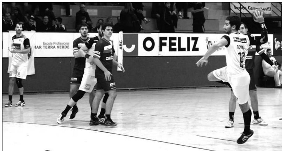
ABC procura ultrapassar hoje o Passos Manuel

As partidas agendadas para hoje referentes ao segundo jogo do play-off: ABC/UMinho-Passos Manuel (17h00), Sporting-Águas Santas (20h30)