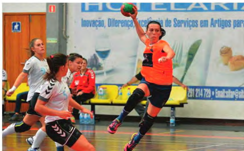
Madeirenses regressam à final-four da Taça.