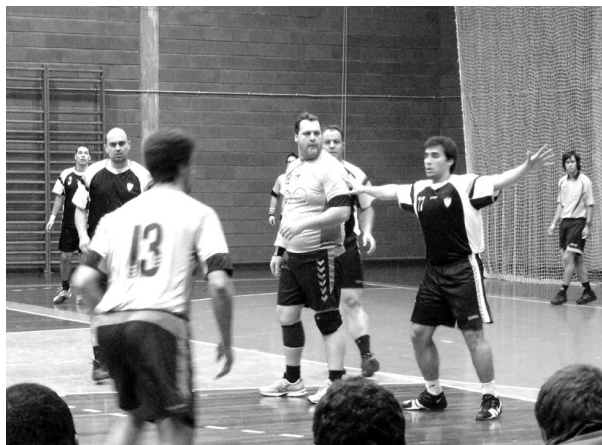
Académico e ABC de Nelas têm os mesmos pontos na prova

O Batalha Andebol Clube é um dos clubes que também corre para um lugar no 'top-five', pois é o grupo que disputará a fase da subida e garante, automaticamente, a manutenção. Assim, recebeu o ABC de Nelas e não desperdiçou a oportunidade de vencer, ainda que com