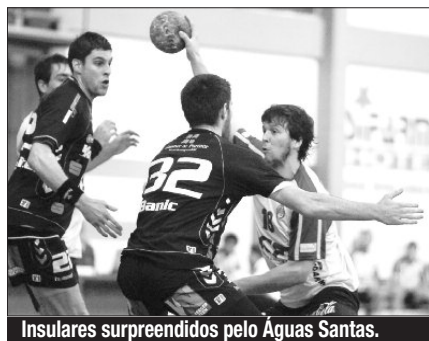
Insulares surpreendidos pelo Águas Santas.

O Madeira SAD perdeu, ontem, frente ao Águas Santas, por 25-28, na 1.ª jornada da Supertaça masculina de Andebol que começou no Portimão Arena, no Algarve. Um jogo onde os madeirenses apenas se podem culpar a si próprios, já que estiveram a ganhar por seis bolas, resultado com que se atingiu o intervalo (16-10). Os maiatos reagiram na 2.ª parte e chegaram mesmo à vantagem a 12 minutos do fim, não permitindo mais que a “sociedade” da Madeira recuperasse no marcador. Águas Santas que am-