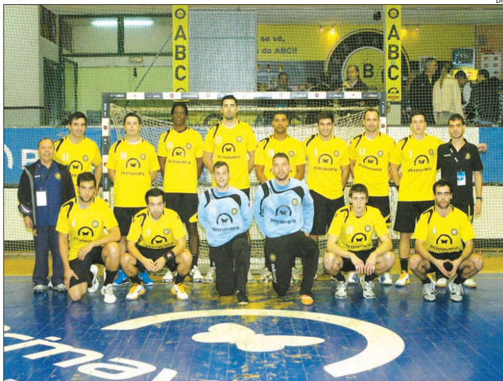
ABC quer conquistar mais um troféu para a sua vitrina