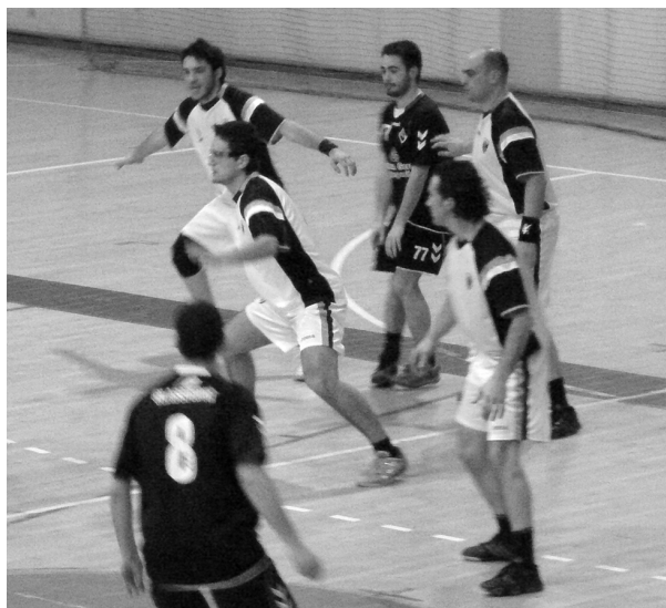
Os jogadores do Académico mostraram eficácia em Castelo Branco