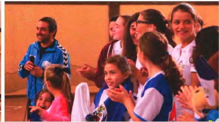
Torneio camachense foi bem disputado e serviu como boa propaganda do andebol. FOTOS DR