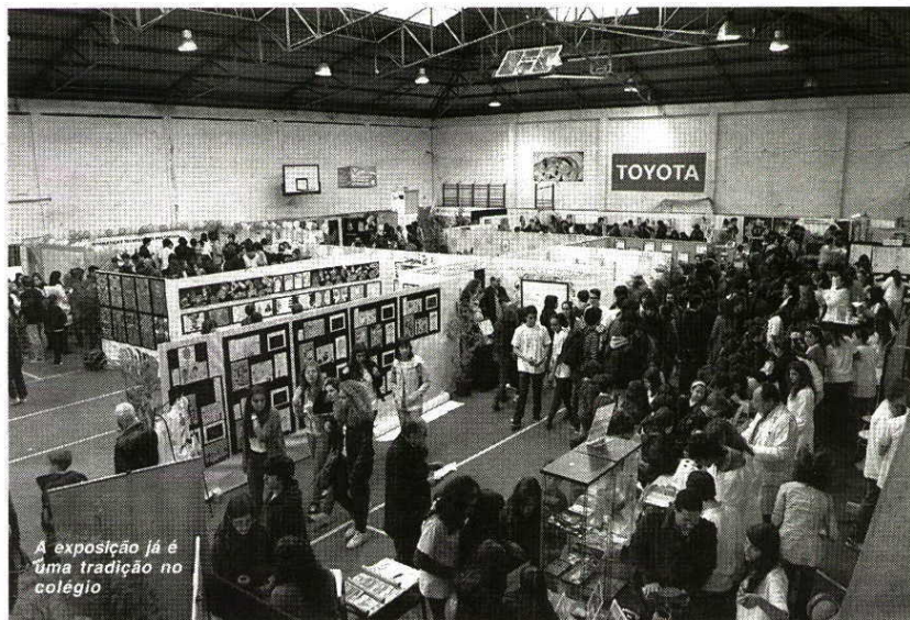
A exposição já é uma tradição no colégio