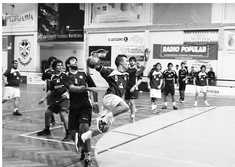
CLUBE compete na formação e para os lugares de topo a nível regional

pavilhões de algumas escolas, como a E.B. 2.3 Fernando Pessoa e de Arrifana.