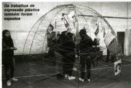
Os trabalhos de expressão plástica também foram expostos