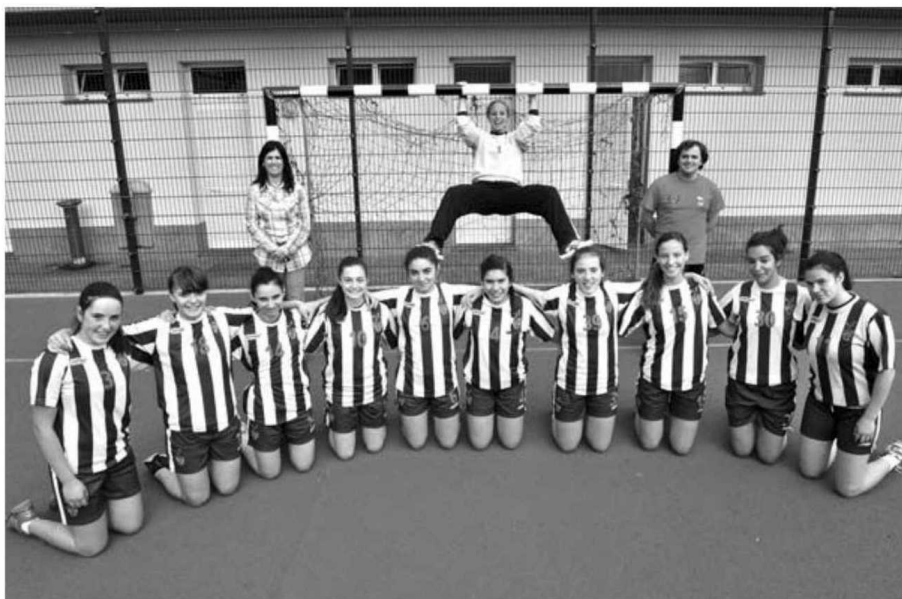
A equipa de juvenis do Sports Madeira é a primeira a entrar em acção.