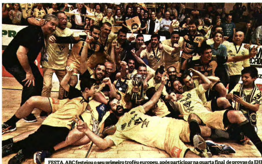
FESTA. ABC festejou o seu primeiro troféu europeu, após participar na quarta final de provas da EHF