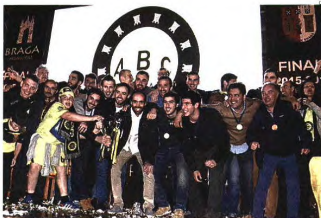
A festa foi grande entre adeptos, jogadores e dirigentes do ABC