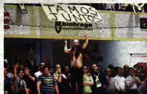
Adeptos criaram ambiente fantástico no pavilhão Flávio Sá Leite