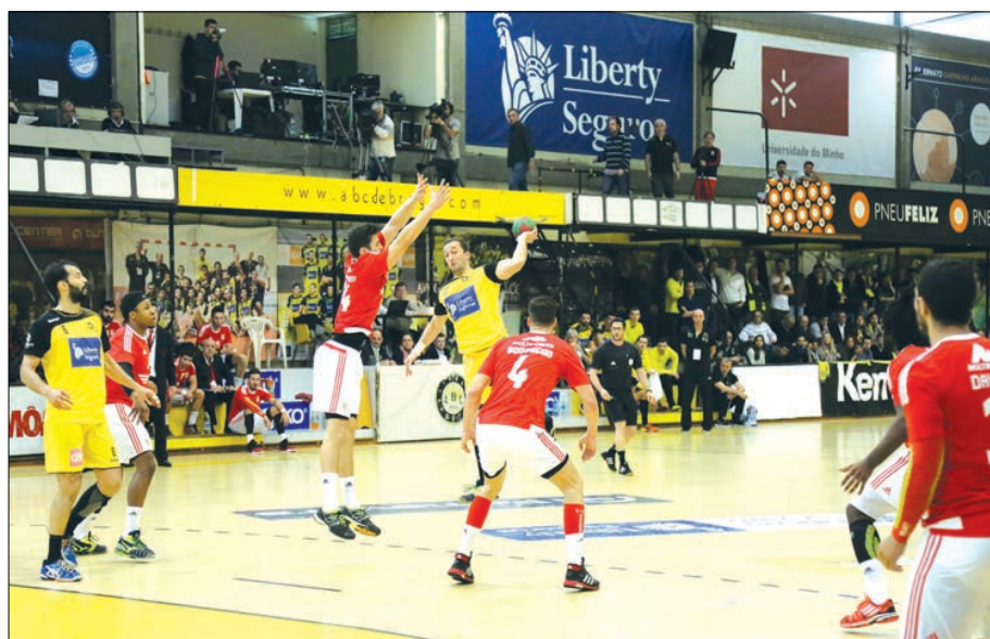
ABC volta a medir forças esta tarde com o Benfica