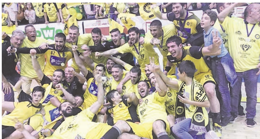
Público encheu ontem o pavilhão como se via na década de 1990