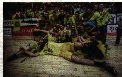
Festa dos heróis do ABC, que entraram para a história do clube