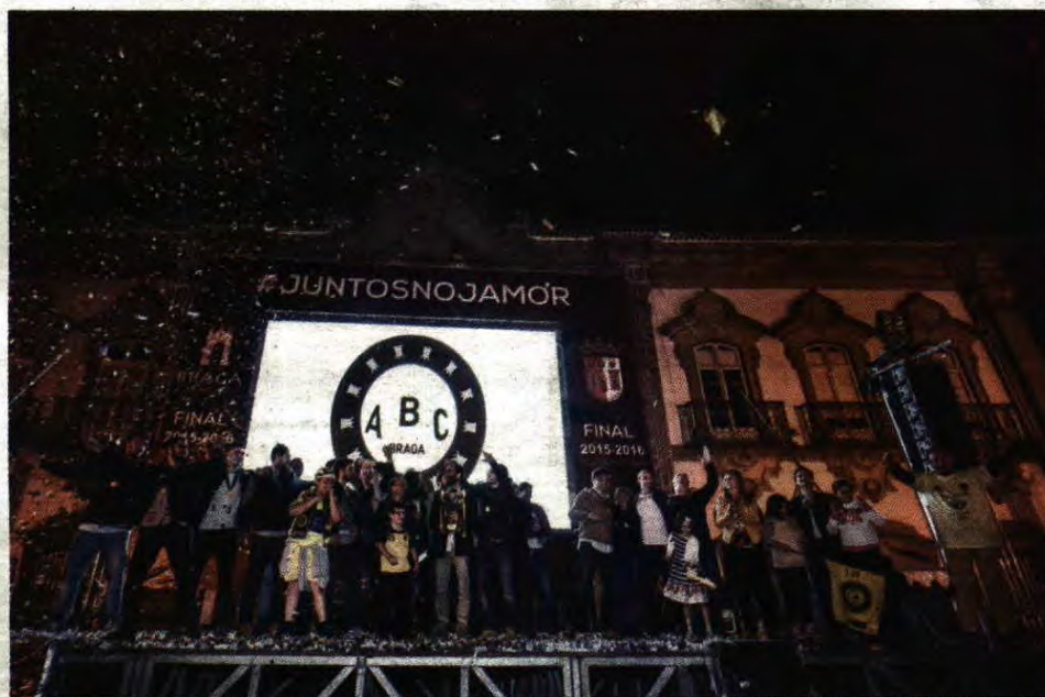
Plantel minhoto deslocou-se ao edifício dos Paços do Concelho, no coração de Braga, para celebrar a conquista de um título inédito