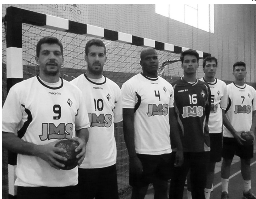
A Artística conta com seis reforços para "atacar" a subida

Plantel O clube de Avanca conta com seis reforços para atacar o regresso à 1.ª Divisão Nacional, tarefa que, contudo, não se prevê fácil