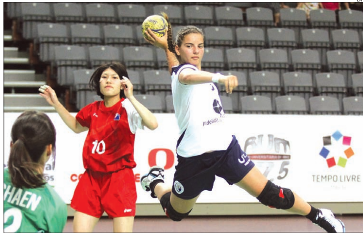
... e perdeu em femininos

Após a jornada inaugural do campeonato do mundo de andebol universitário que está a decorrer em Guimarães, em que nos dez jogos realizados imperava a incógnita, a segunda jornada já foi bem diferente, e as seleções portuguesas tiveram sortes diferentes.