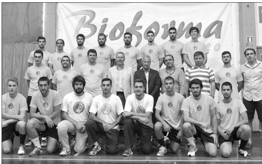
Madeira Andebol SAD iniciou os trabalhos para a nova época no Andebol 1.