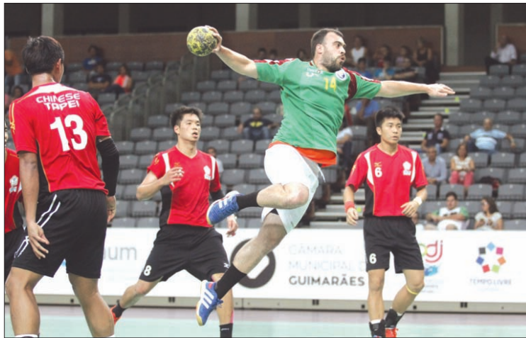
Portugal venceu em masculinos...