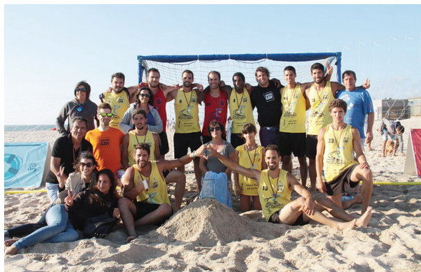
Os “Vakedo Gaw” fizeram a festa na praia de Esmoriz