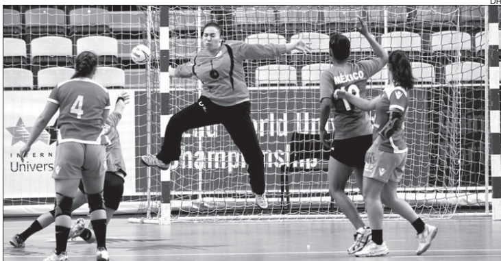
Guarda-redes portuguesa esteve em bom plano frente ao México

Portugal entrou da melhor forma no campeonato do mundo de andebol universitário que está a decorrer em Guimarães, ao vencer em masculinos (34-29) e em femininos (24-17).