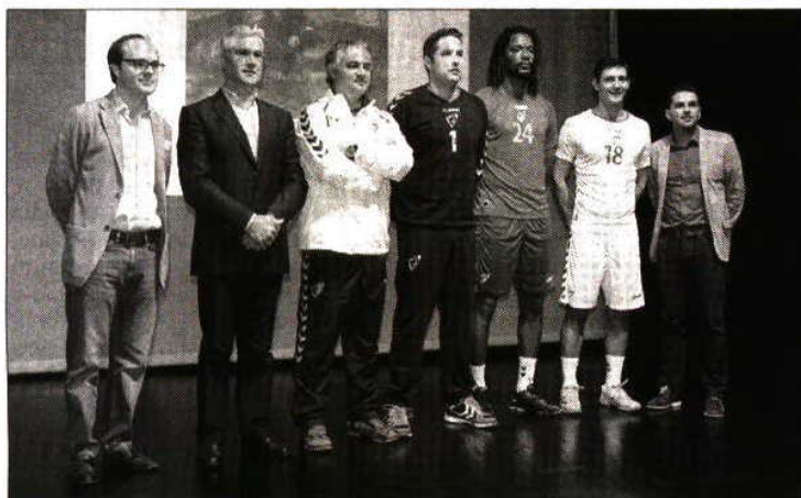
Autarcas, seleccionador e jogadores na apresentação dos novos equipamentos da Selecção Nacional de Andebol