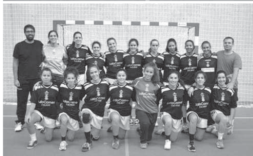
As três equipas oliveirenses