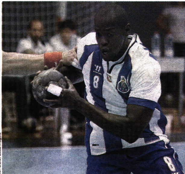
Ivo Pereira / Global Images

Em Lisboa, o Sporting manteve também a caminhada vitoriosa, desta vez na visita