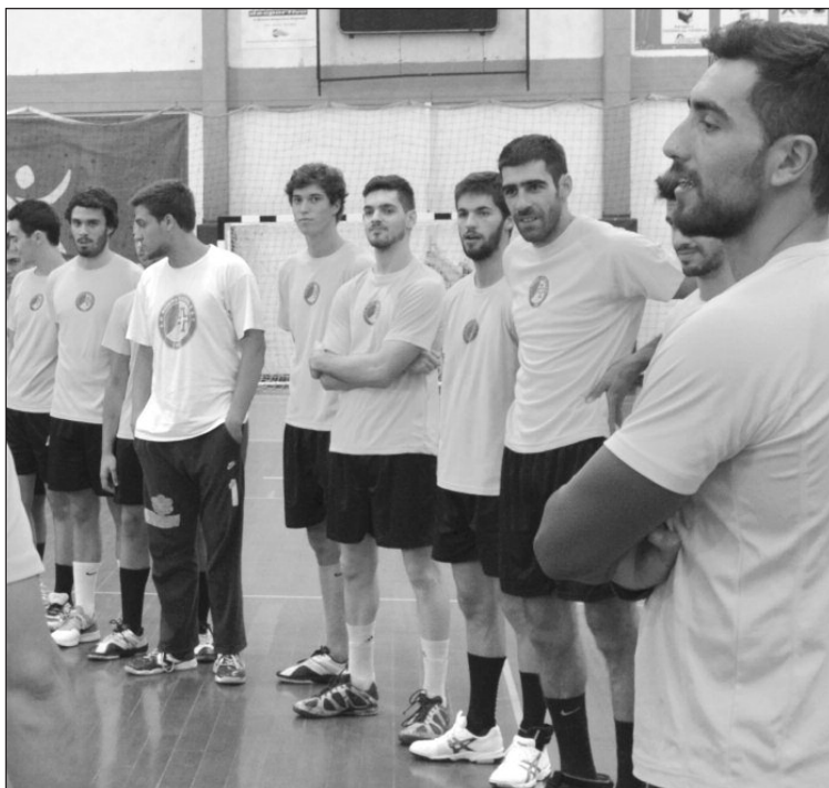
Masculinos do Madeira SAD contam por vitórias os (dois) jogos realizados.

Nos femininos, o fim de semana é de jornada dupla para as equipas madeirenses, com Madeira SAD e Sports