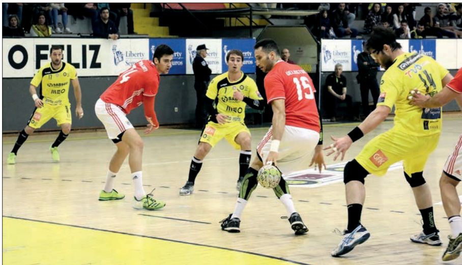
ABC e Benfica reencontram-se hoje, desta vez em Lisboa

Já sem hipóteses de lutar pelo título de campeão nacional, ABC e Benfica defrontam-se hoje, a partir das 17h00, no Pavilhão Flávio Sá Leite, em encontro da oitava jornada da fase final do campeonato.