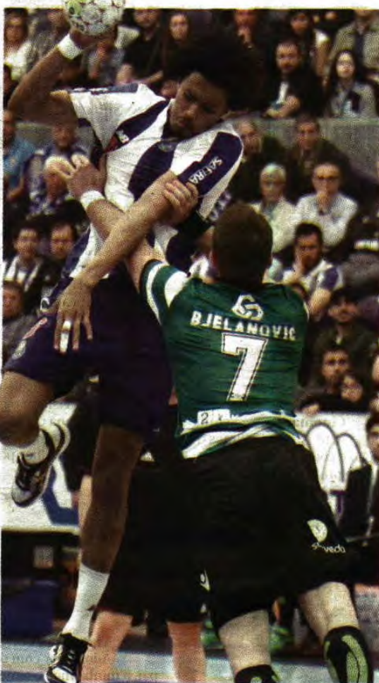
Portistas têm oito vitórias consecutivas nos clássicos com os leões