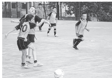
Zumba, Andebol e Futebol são, por enquanto, as três modalidades promovidas pelo “renascido” GD Azinhaga.

veio a integrar aquela a que presido, conseguiram encontrar uma solução para não deixar cair o clube», explica, acrescentando que as “forças vivas” da freguesia também colocaram o seu “grão de areia” no projecto de recuperação que «hoje tem um trabalho para mostrar».