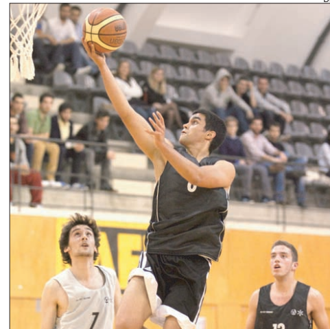
Alguns dos momentos das finais e entrega de prémios da 18.ª edição do Troféu Reitor