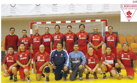
Equipa de veteranos do S. Bernardo que vai disputar o torneio

Andebol Sob organização do S. Bernardo, inicia-se hoje a primeira edição do “Bernas Cup”, um torneio internacional que trará cerca de 1.000 atletas a Aveiro