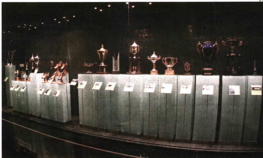
Eis a vitrina do museu do Sporting, com as 22 taças europeias conquistadas em quatro modalidades

Mas...como dizia Fernando Pessoa: «Toda a teoria deve ser feita para ser posta em prática, e toda a prática deve obedecer a uma teoria». Seja como for, foi com um plano deste jaez que Florentino Pérez iniciou, em 2000, a recuperação do Real Madrid até o transformar no primeiro clube de futebol do mundo a ultrapassar os 500 milhões de euros de receita anual.