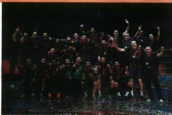
A equipa espanhola do Barcelona conquistou a Liga dos Campeões pela nona vez

O Barcelona derrotou os húngaros do Veszprem, por 28-23, na final da Liga dos Campeões, ontem, na cidade alemã de Colónia. Ao intervalo, já vencia por 14-10. Com a estrela francesa Nikola Karabatic e os seus seis golos, os catalães voltaram a sagrar-se campeões europeus, o que não acontecia desde 2011, e festejam assim, pela nona vez na história do clube, a conquista do troféu mais apetecido. Já Karabatic – que muitos apontam como direto ao Paris Saint Germain – repetiu o que tinha alcançado com Montpellier (2003) e Kiel (2007). A defesa dos