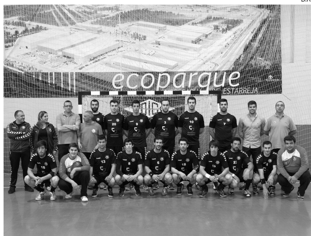
Seniores vão, agora, discutir o título da 3. a Divisão Nacional

Andebol A modalidade no clube estarreense está em alta. Seniores e Júniores garantem a promoção à 2. a e 1. a Divisões das respectivas categorias