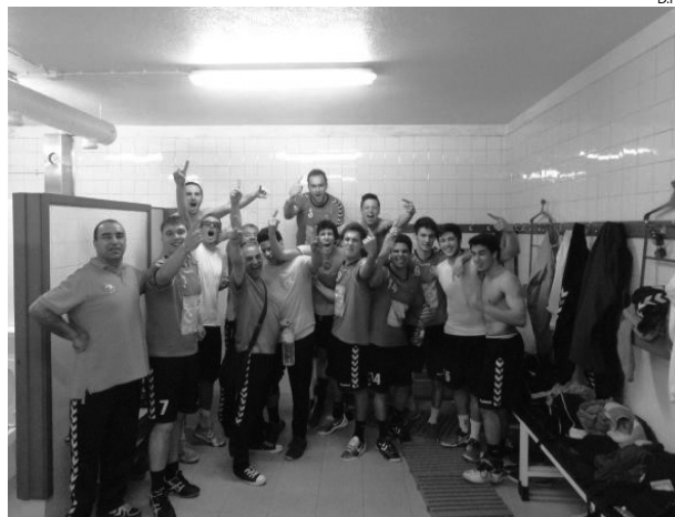
Júniores festejaram a subida e disputam o título da 2. a Divisão