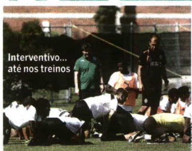
Interventivo... até nos treinos