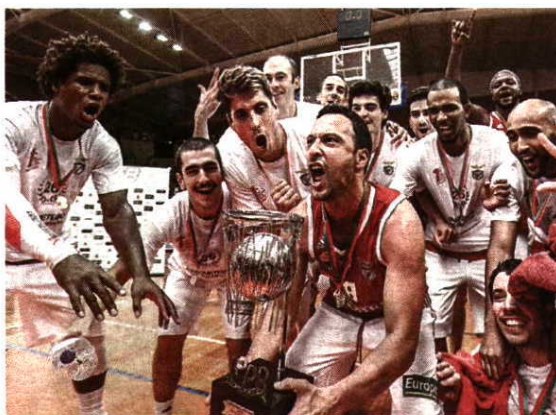
Jogadores do Benfica e o grito do título ao receberem o troféu