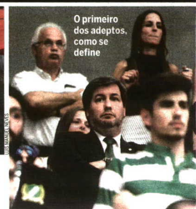
O primeiro dos adeptos, como se define