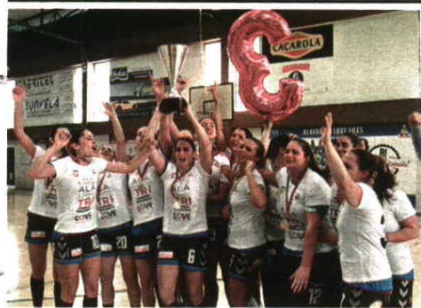
FESTA. Aveirenses comemoram conquista do título

ANDEBOL → EQUIPA DE AVEIRO NÃO DESPERDIÇOU FATOR CASA E VENCE MADEIRA SAD NA "NEGRA"