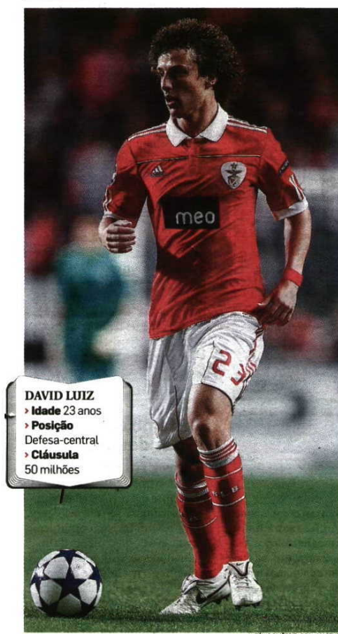
DAVID LUIZ > Idade 23 anos > Posição Defesa-central > Cláusula 50 milhões