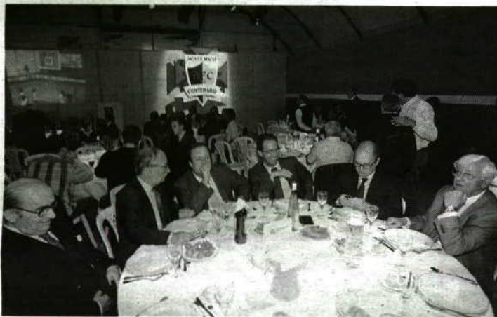
Mesa de notáveis no jantar dos 99 anos do Académico

— Noite de gala, ontem no Porto, com o jantar do 99.º aniversário do Académico Futebol Clube a reunir mais de 200 pessoas, no ginásio do clube. Conhecido pelas grandes vitórias no ciclismo, andebol, basquetebol, hóquei em patins, mas também no futebol, o emblema portuense conseguiu juntar alguns atletas internacionais e dezenas de sócios que foram