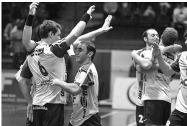
Excelente vitória do Madeira SAD em Aveiro