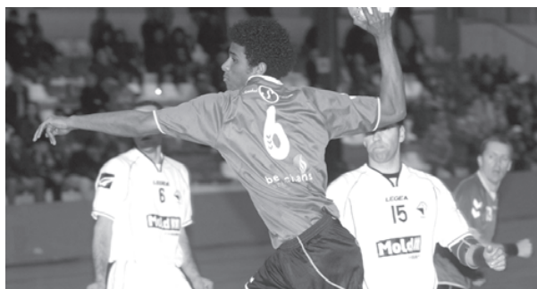
DIFÍCIL – Sadinos defrontaram opositor muito combativo

FICHA DO JOGO: Árbitros: Mário Coutinho e Ramiro Silva; oficial de mesa: António Brousse.