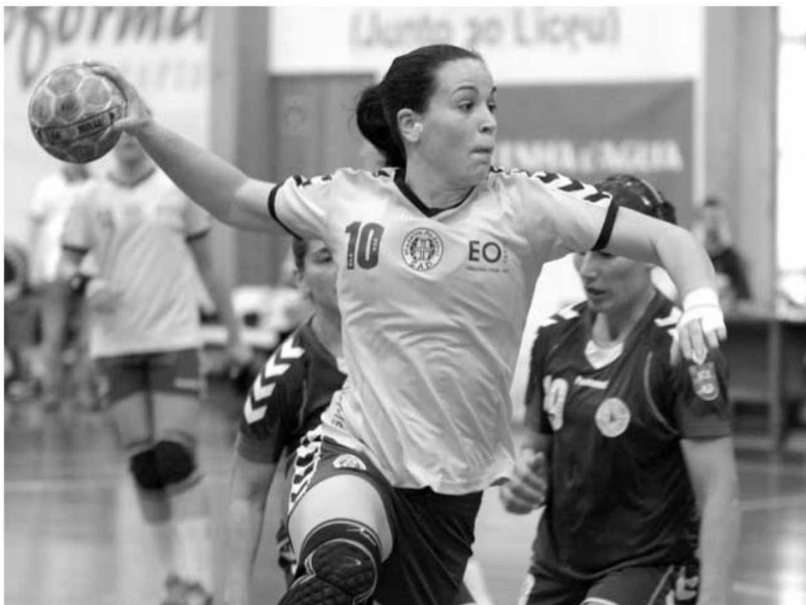
As madeirenses voltaram a revelar fragilidades na ponta final da partida.

HERBERTO D. PEREIRA desporto@dnoticias.pt