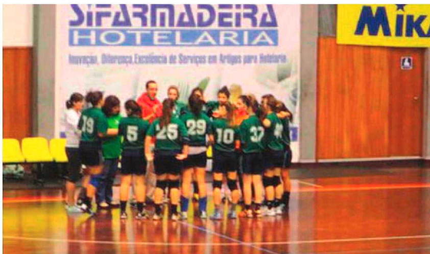
Em juvenis femininos as 'estudantes' revalidaram o título regional a uma jornada do fim do campeonato.

Nos rapazes o Académico do Funchal mostrou o seu domínio que já trazia da primeira fase do campeonato, e na derradeira fase final veio a erguer o troféu de campeão na penúltima jornada. Apesar do empate cedido diante do Marí-