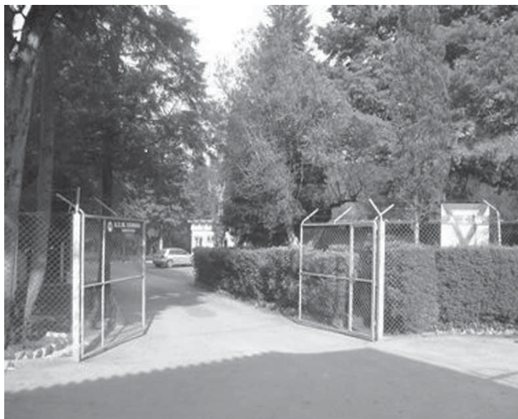
O campo Conde Foz de Arouce é um local apazível da ACM Coimbra

associação tem em curso envolvem as seguintes entidades: AIESEC; Antigos Tunos da Universidade de Coimbra; APPC - Associação de Paralisia Cerebral de Coimbra; A Pequena Sereia - Actividades de Tempos Livres, Lda; Associação Cultural Alternativa; CEIFAC; Colégio S. José; Cooperativa de Ensino de Coimbra; CAD - Associação de Coimbra Basquete; Casa da Madeira de Coimbra; Federação de Andebol de Portugal; Grupo Alves Bandeira; ISCAC; Obra de Promoção Social do Distrito de Coimbra; Teatro Académico de Gil Vicente.