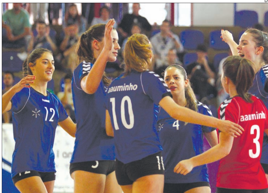
Voleibol feminino em ação

As equipas da UMinho que estão a disputar os europeus (andebol masculino, futebol 11 masculino e voleibol feminino) terminaram a primeira fase dos seus campeonatos e vão agora lutar pela passagem às meias-finais da prova. Se para o andebol a tarefa se avizinha fácil, já para o futebol e volei-