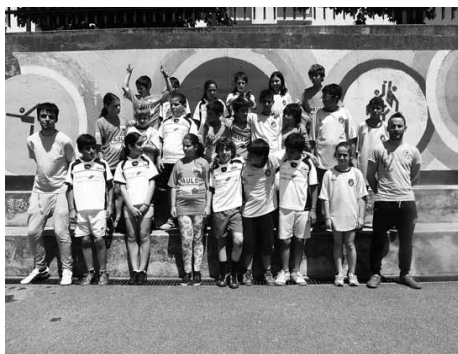
2º Torneio de Andebol da Escola Básica de Vouzela

No passado sábado, dia 15 de junho, realizaram-se as comemorações do 25º aniversário da Associação de Andebol de Viseu.