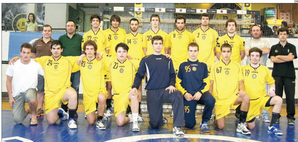
Juniores do ABC querem trazer o título para Braga

O ABC foi a equipa mais regular da época, ao terminar a 1.ª fase no primeiro lugar, mas as maiores dificuldades surgiram na fase intermédia, onde a equipa orientada por Raul Maia ficou no segundo posto, atrás do Sporting, mas