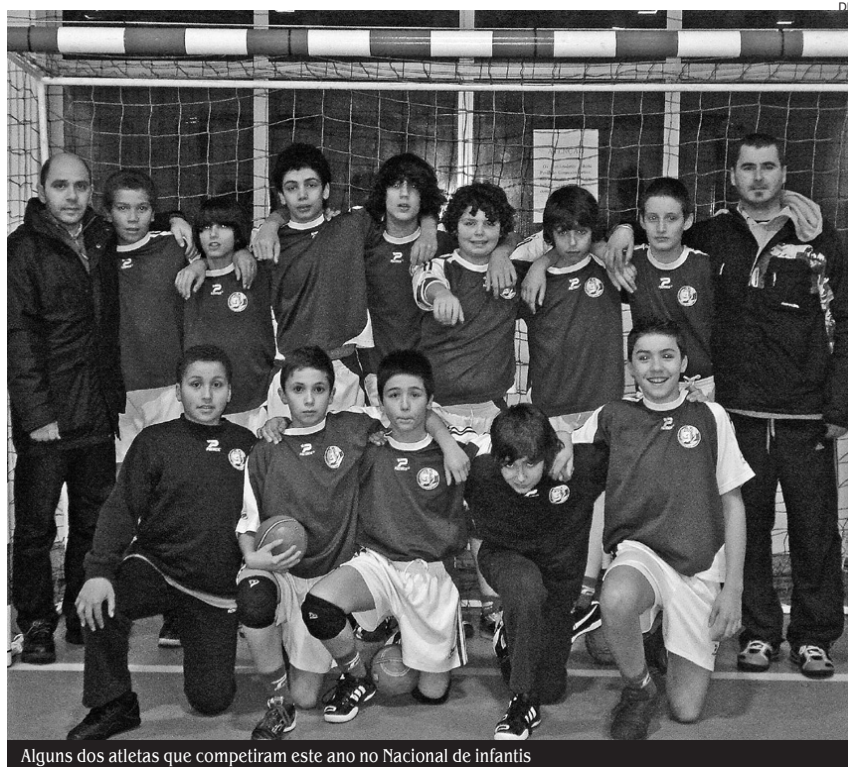
Alguns dos atletas que competiram este ano no Nacional de infantis