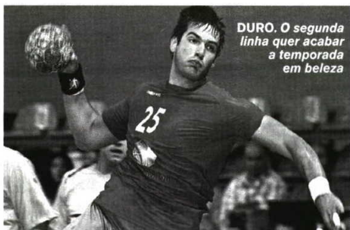
DURO. O segunda linha quer acabar a temporada em beleza

porque temos de estar no meio da defesa contrária, numa modalidade com muito contacto físico. Mas é normal ser-se duro nessas situações, pois o nosso objetivo é criar espaços para o remate dos companheiros ou receber a bola para finalizar.” Para o segunda linha, a chave do jogo frente à Polónia é o mesmo de sempre. Portugal tem de defender bem para travar os possantes adversários do Leste. AR □