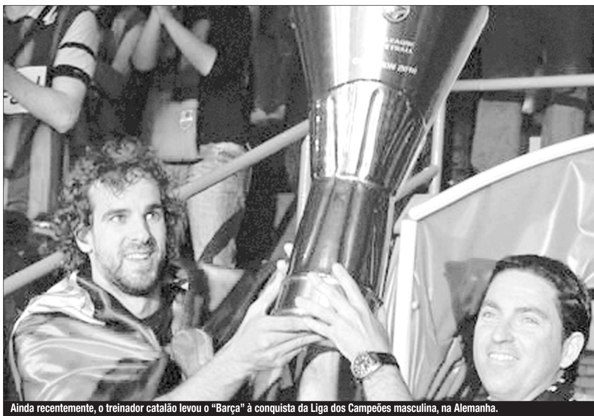
Ainda recentemente, o treinador catalão levou o "Barça" à conquista da Liga dos Campeões masculina, na Alemanha.

O treinador campeão da Europa pelo Barcelona estará no Funchal, no decurso da próxima semana para ser prelector do Curso de Grau IV da Associação de Andebol da Madeira.