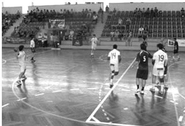
Em Mangualde disputou-se uma das fases de apuramento para a final

Na 'final four' prevêem-se jogos de grande emoção, já a partir de amanhã, pois os clubes participantes são de valor semelhante, sendo uma incógnita quem se sagrará campeão nacional, embora Sporting e FC Porto se apresentem, ligeiramente, favoritos.