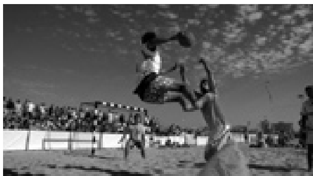
PRAIANDEBOL decorre no areal grande da Praia da Vitória

Entretanto, já estão calendarizados os próximos PraiAndebol 2011, os quais obedecem ao seguinte programa: II PraiAndebol, 10 de julho, às 15:00; III PraiAndebol, 31 de julho, 15:00 (integrado no programa das Festas da Praia); IV PraiAndebol, quatro de setembro, 15:00.