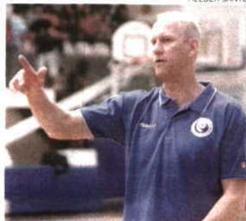
Olsson leva os mesmos 16 convocados