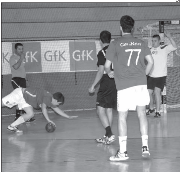
Equipa do Arsenal está confiante no título em ano de estreia