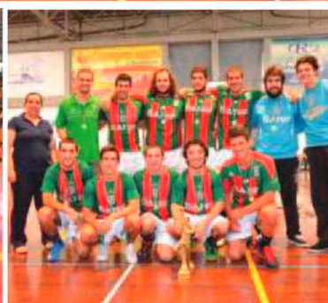
O andebol regional terminou mais uma temporada em festa.