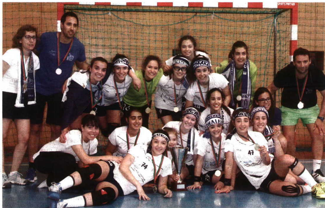
CAMPEÃS. Jovens de Alcanena continuam a marcar a história do andebol jovem em Portugal

Depois de uma prova muito equilibrada entre Alavarium e Bartolomeu Perestrelo, que terminou com a vitória da equipa madeirense por um golo (25-26), entraram em campo Jac-Alcanena e Maiastars, sabendo