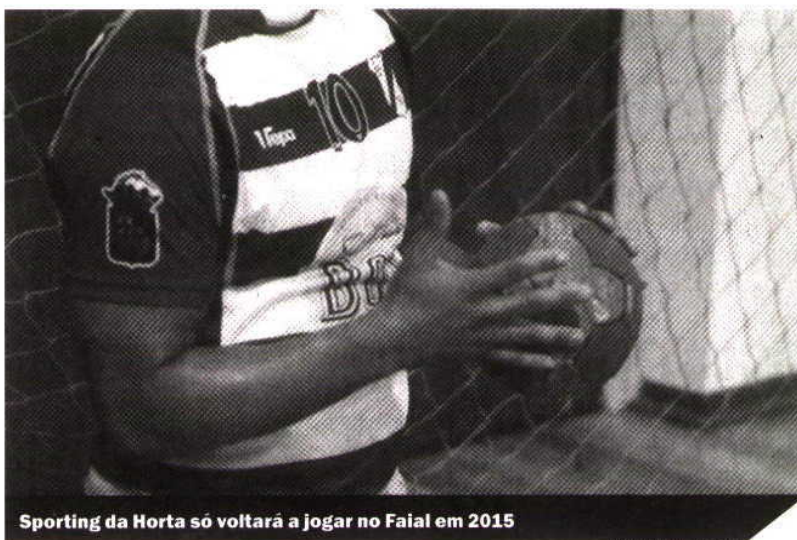
Sporting da Horta só voltará a jogar no Faial em 2015

Como já foi referido, a segunda volta da equipa faialense será feita fora da ilha. Sábado a equipa jogará com o Maia, seguindo-se uma deslocação ao arquipélago da Madeira. A 13 e 17 de dezembro o Sporting da Horta defrontará o Porto e o Xico Andebol, respetivamente.