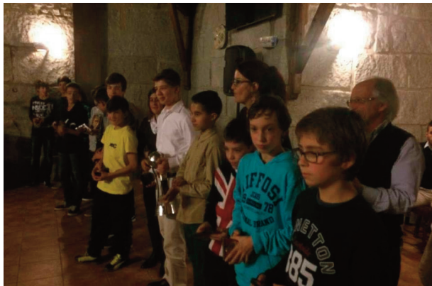
Equipa de infantis de futsal foi homenageada

FESTA O ABC de Nelas realizou anteontem o tradicional jantar de Natal, no qual participaram diversas individualidades, para além daqueles que fazem o dia-a-dia da popular colectividade,