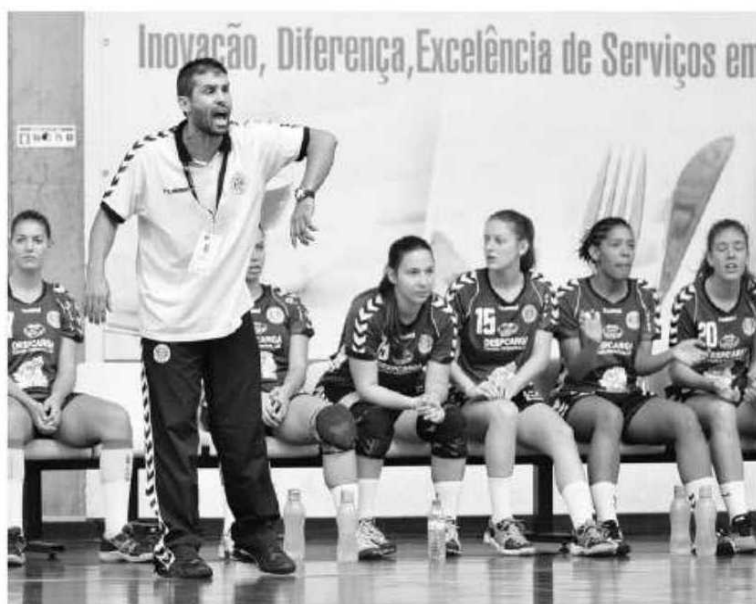
Madeirenses bateram as nortenhas por 22-20.