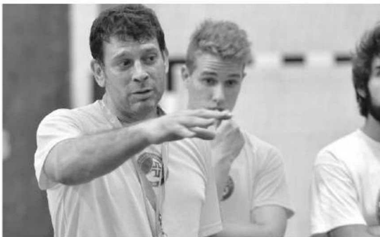
Madeira SAD recebe o Águas Santas.

O principal destaque na tarde vai para o encontro que terá lugar às 17 horas com o Madeira SAD a fechar um ciclo de quatro partidas na Região, recebendo o Águas Santas. Um encontro onde de novo, os dois protagonistas se apresentam em campo com os mesmos pontos, (26) nas 13 partidas realizadas. Em quinto lugar encontram-se os nortenhos, vantagem da vitória na primeira volta (26-24) com o Madeira SAD logo atrás. Um jogo obviamente bem complicado para os madeirenses no entanto a motivação de terminar este ciclo com mais três pontos, cruciais para o futuro, poderá ser determinante para que o Madeira SAD vencer.