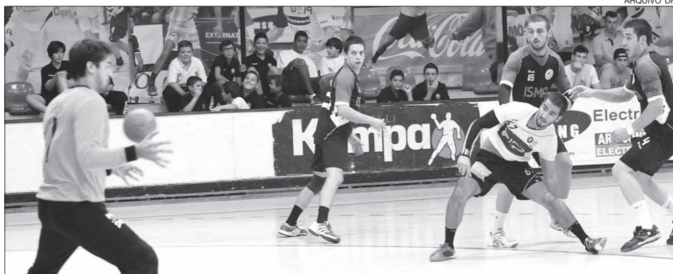
ABC/UMinho não hipóteses ao Maia/ISMAI

O ABC/UMinho venceu ontem na Maia o ISMAI, por 22-14 e seguiu o segundo lugar no campeonato nacional da I Divisão.