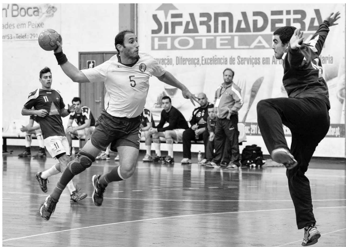
Masculinos da SAD empataram ontem com o Águas Santas, o que constitui um bom resultado.