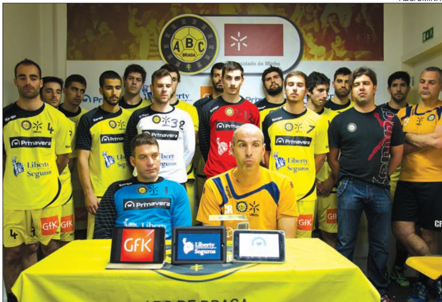
Plantel do ABC/UMinho reunido para festejar a conquista de um lugar europeu