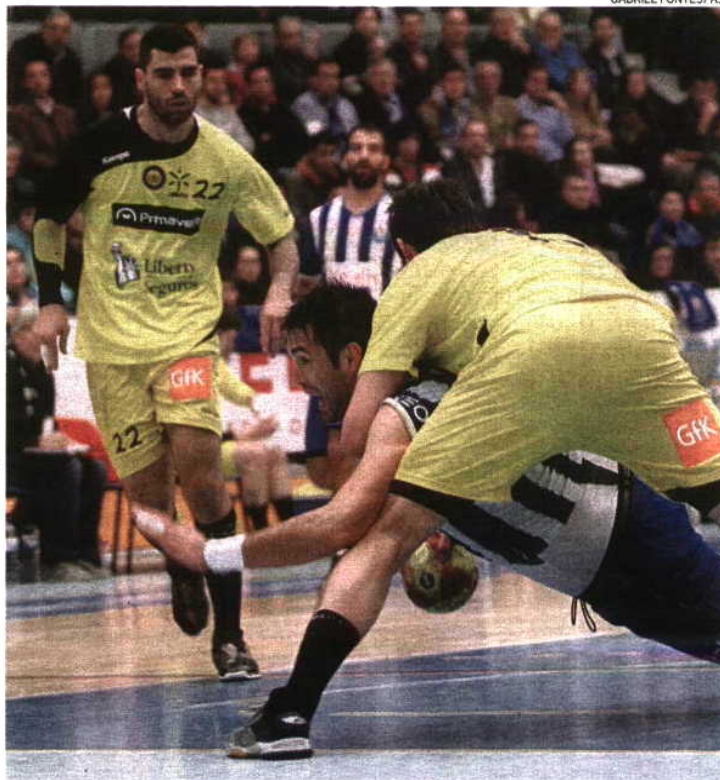
FC Porto ainda não venceu em Braga este ano e, em três partidas, apenas ganhou uma