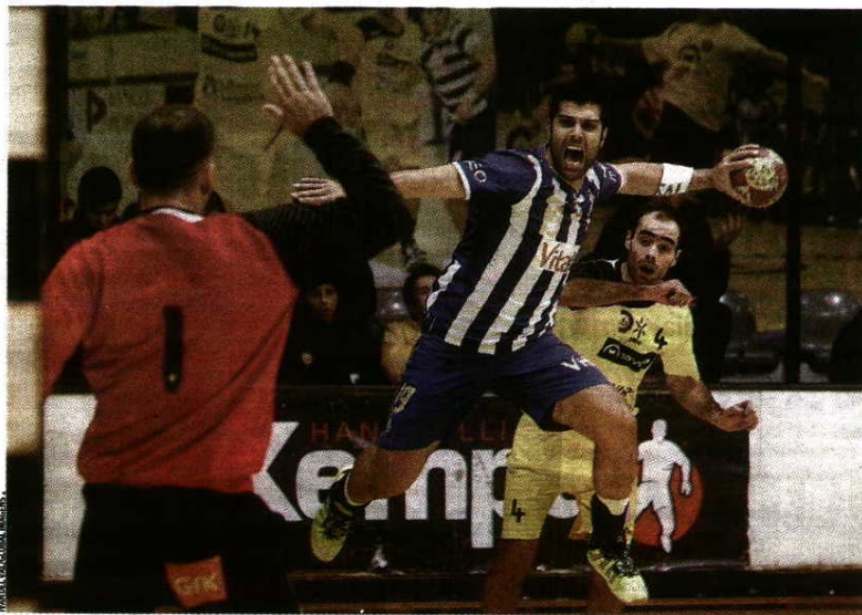
Emoções > Espera-se um pavilhão cheio e muito luta no ABC-FC Porto que pode valer o título

Numa jornada que acaba por remeter o Benfica-Sporting para