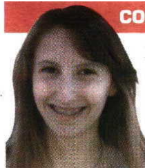
Por Daniela Silva Oliveira

A 2ª jornada da 2ª Divisão do Campeonato Nacional de Andebol trouxe o Xico Andebol de volta ao topo, liderando agora a Fase Final desta competição com 6 pontos. Também com 6 pontos, e em segundo lugar, está o Santo Tirso que derrotou o CDE Camões por 22-38. A fechar o pódio nesta nova fase está São Mamede, com 4 pontos, depois de derrotar o SL Benfica B, por 34-29.