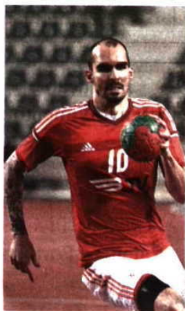
Esquerdino deixa a Luz

ANDEBOL → DEPOIS DO ACORDO COM O BÉNFICA CLUBE INSULAR NEGOCEIA COM O JOGADOR