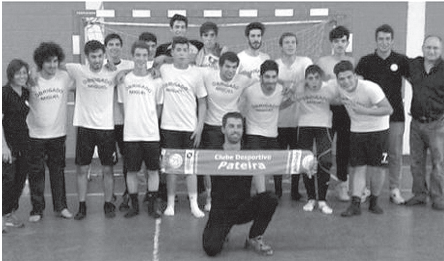
▲ Juvenis masculinos do CD Pateira