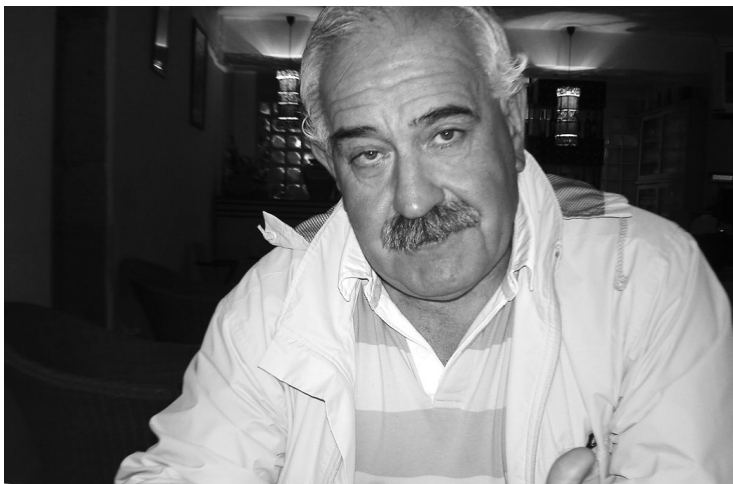
COORDENADOR recordou os primórdios do evento, em 1976, e o entusiasmo que então se viveu

A edição deste ano vai apresentar, ainda, duas modalidades de exibi-