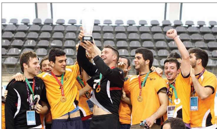
Equipas de andebol e futsal masculinas da Universidade do Minho sagraram-se campeãs nacionais