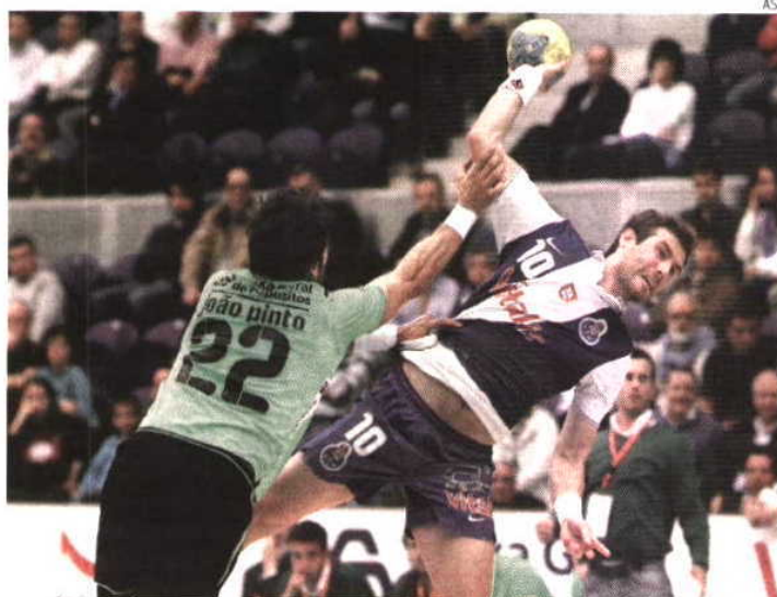
Amanhã é esperado mais um duelo escaldante no Dragão Caixa, com a visita dos leões

Deste modo prevê-se encontro escaldante no Dragão Caixa, até porque caso os leões acumulem novo desaire igualam o registo terrível do início da época 2007/08, em que as quatro derrotas consecutivas custaram o lu-