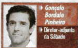
Gonçalo Bordalo Pinheiro