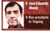
José Eduardo Moniz