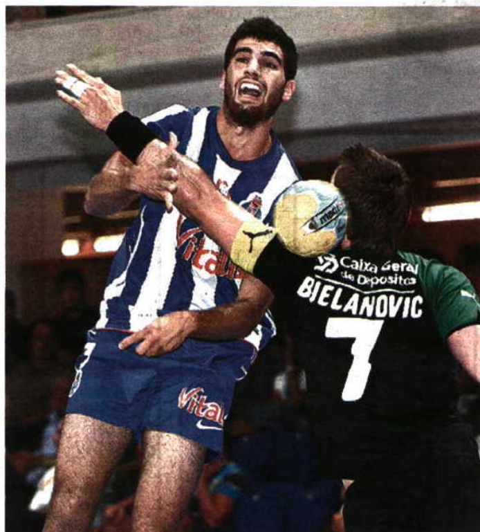
CLÁSSICO. Bicampeões estão determinados a ganhar o jogo