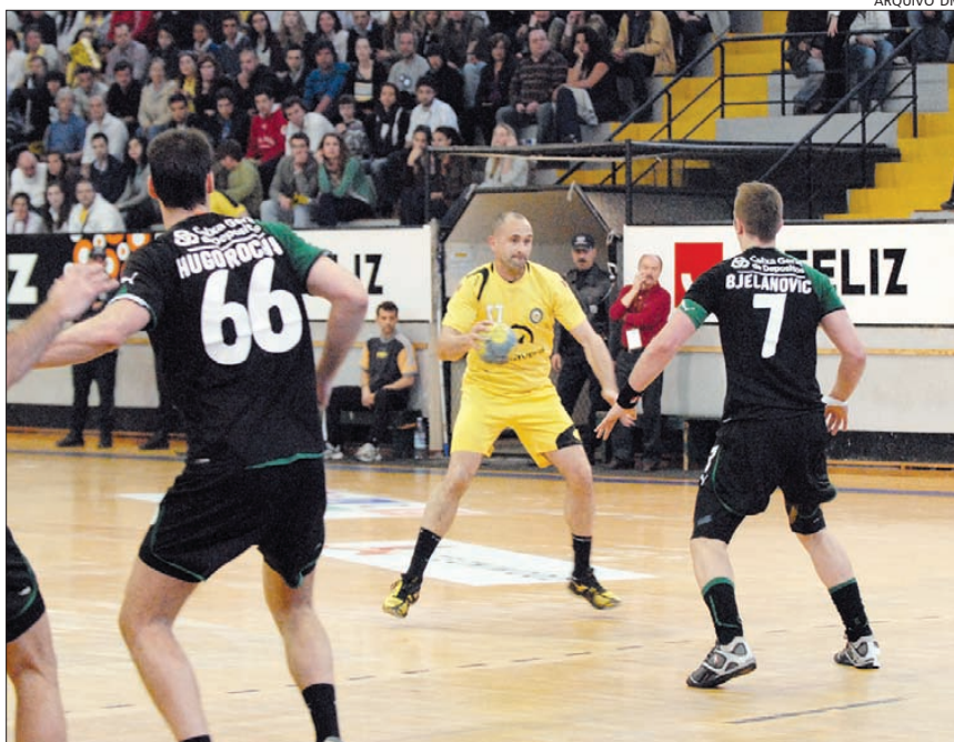
ABC não conseguiu somar novo triunfo no campeonato

Reentrou melhor a equipa de Jorge Rito, com um parcial de 2-5, que levou os bracarenses à primeira de várias vantagens de quatro golos (11-15) aos 40 minutos. A vencer por 13-17, um pouco antes do minuto 50, o ABC teve uma branca que durou até ao final da partida, per-