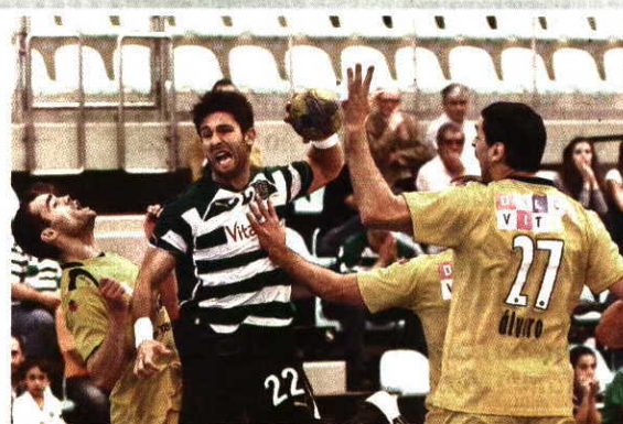
O Sporting operou uma reviravolta espectacular no duelo com o ABC