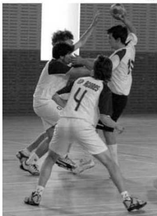
Prova começa amanhã na Sardenha

Os Jogos das Ilhas, que visam promover o desporto entre a juventude insular europeia, contam