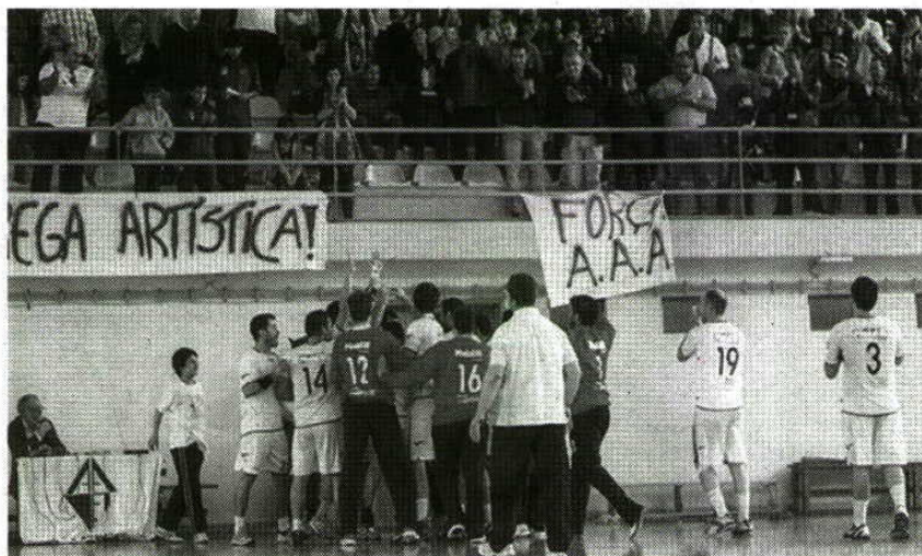
APOIO DO PÚBLICO foi precioso em mais uma vitória da Artística