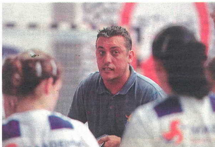
Madeirenses estreiam-se na prova a 12 de Março.