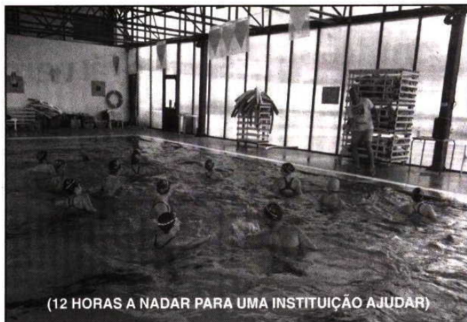
(12 HORAS A NADAR PARA UMA INSTITUIÇÃO AJUDAR)

Consulte toda a informação acerca da atualidade do Ginásio em www.ginasioclubesantotirso.com e em facebook.com/ginasioclubesantotirso