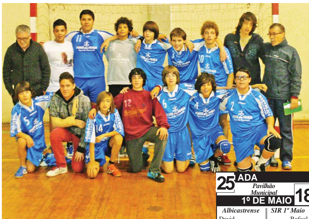
Iniciados jogam com equipas de Leiria