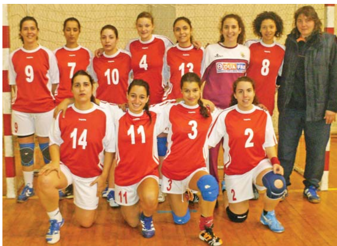
CBCB vai crescer com a competição

A treinadora da CBCB assegura que as suas pupilas