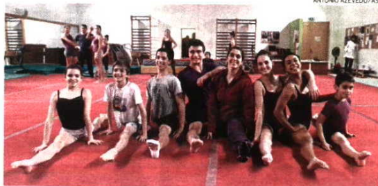
O grupo de ginastas que quer mostrar do que é capaz em Orlando, nos EUA