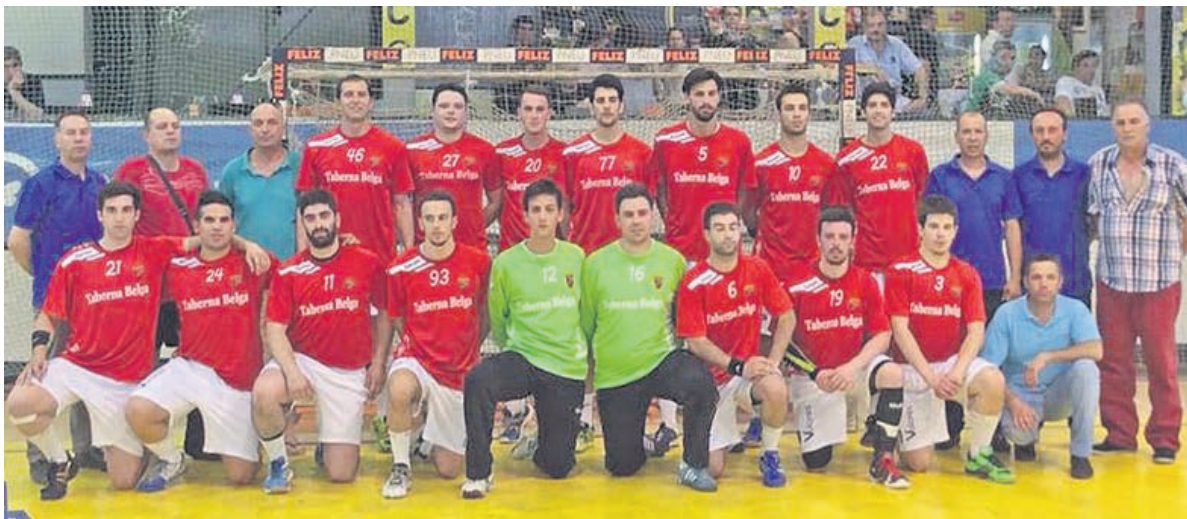
Com duas vitórias claras nos dois encontros da final, o Arsenal da Devesa conquistou o título da III Divisão Nacional de andebol