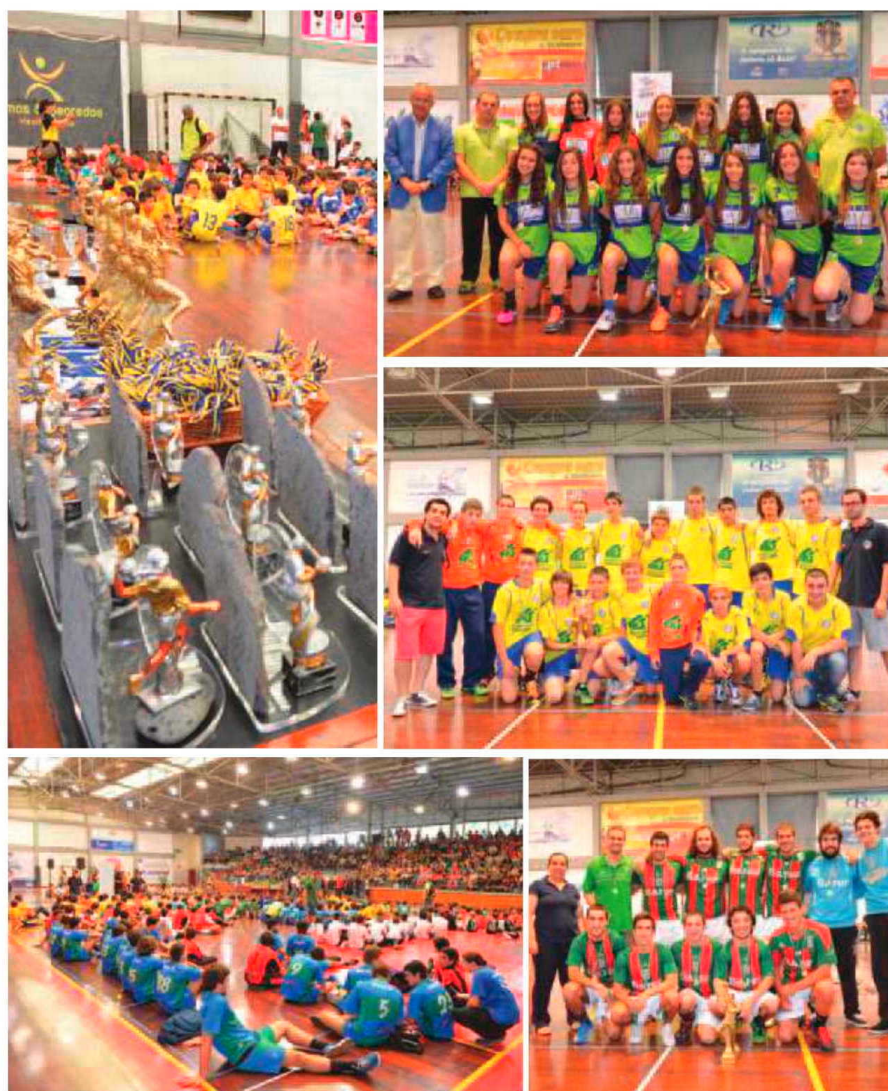
O andebol regional terminou mais uma temporada em festa.