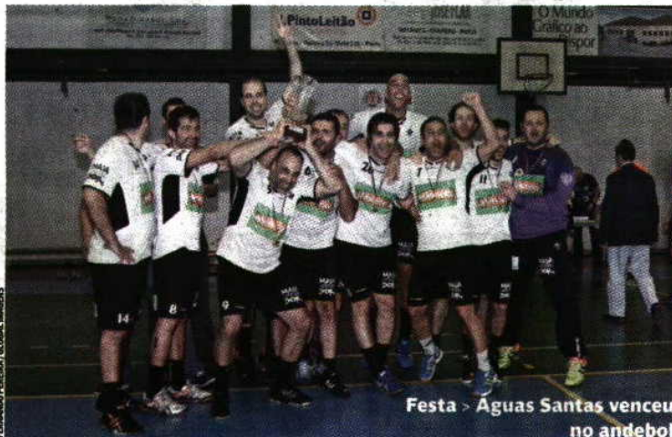
Festa &gt; Águas Santas venceu no andebol