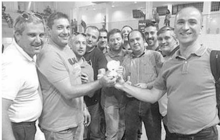
'Velha Guarda' exhibe com orgulho o troféu conquistado na Maia.

Por tudo isto, os madeirenses transmitiram ao DIÁRIO que o balanço da primeira participação da 'Velha Guarda' num torneio de veteranos fora da Madeira foi de veras positiva, sendo de registar o convívio que proporcionou a 'maratona'. F.S.