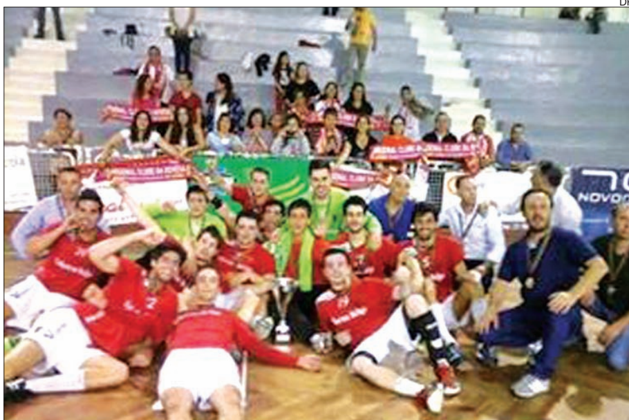
Jogadores do Arsenal da Devesa fizeram a festa no Pavilhão Paz e Amizade