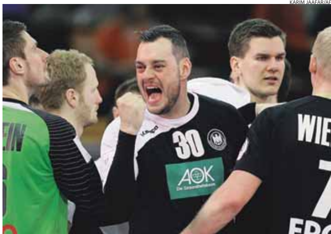
A Alemanha impôs-se por 29-26 no segundo dia do Mundial