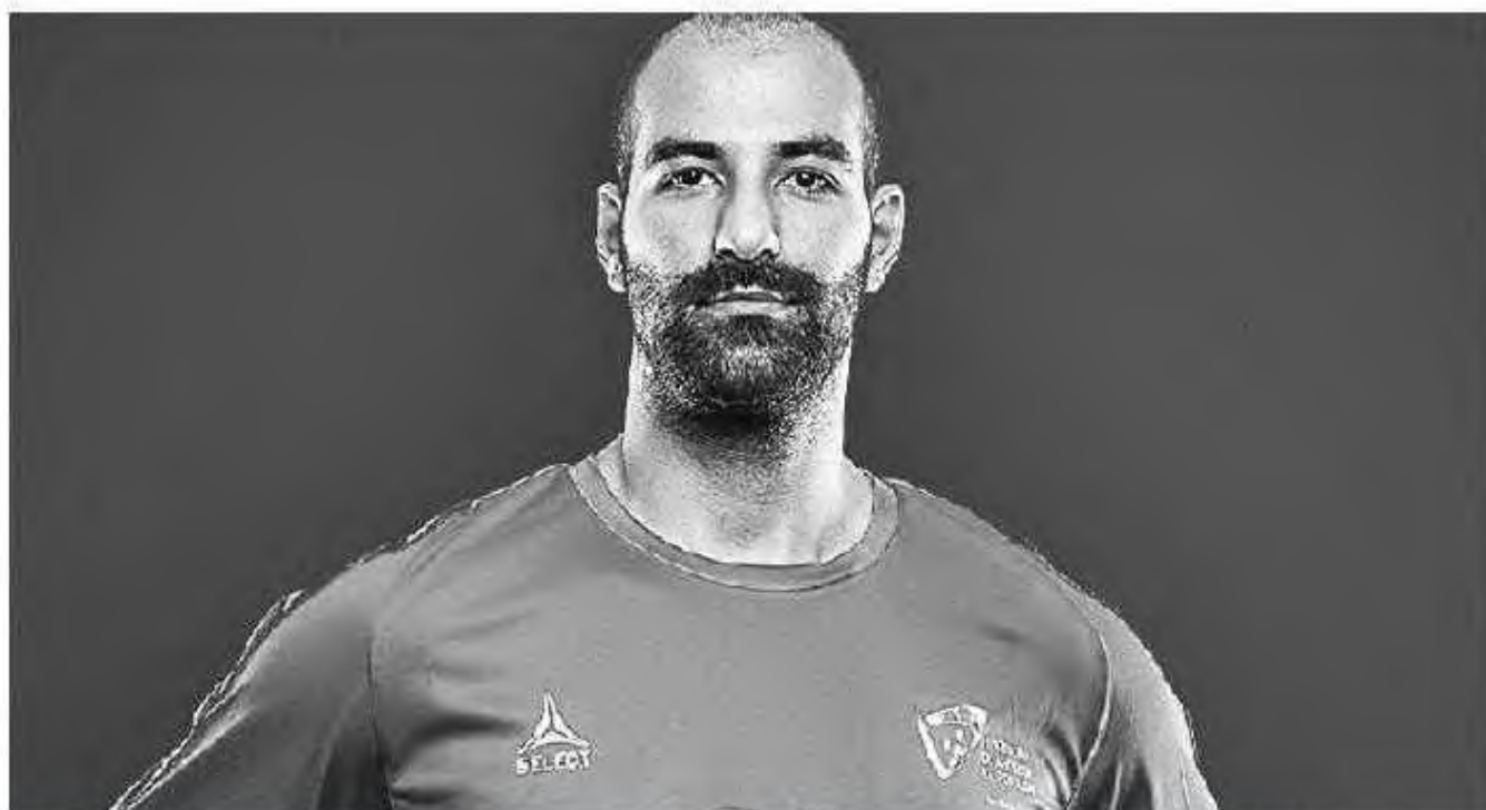
Madeirense chamado para disputar o play-off para o Mundial'2019.