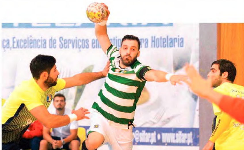
Na primeira volta os leões vieram ao Funchal vencer por 36-27.

Hoje, frente ao Sporting que lidera a competição com 45 pontos, (16 jogos realizados, 14 vitórias, um empate e uma derrota), os madeirenses irão de novo certamente sentir imensas dificuldades face ao natural favoritismo dos leões que, relembrasse, veio ao Funchal na primeira volta vencer por 36-27. Os madeirenses perseguem agora um lugar para a fase final objectivo complicado face a um conjunto de resultados e dificuldades sobretudo lesões, mas toda a equipa acredita ser capaz de lá chegar. União não falta no plantel que logo à tarde pode muito bem como é seu hábito obrigar o seu adversário a