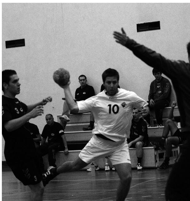
ACADÉMICA e ABC Nelas encontram-se à 11.ª jornada

E a Académica - que para o novo ano não poderá contar