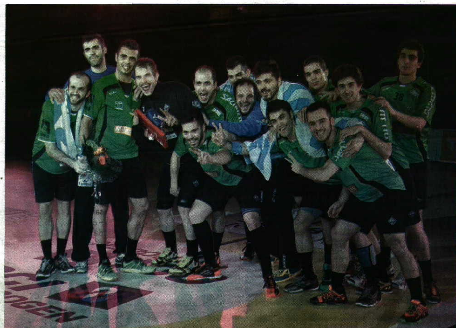
Orgulho - Águas Santas fez pela primeira vez quatro jogos em dois dias e melhorou em todos eles. Agora é favorito