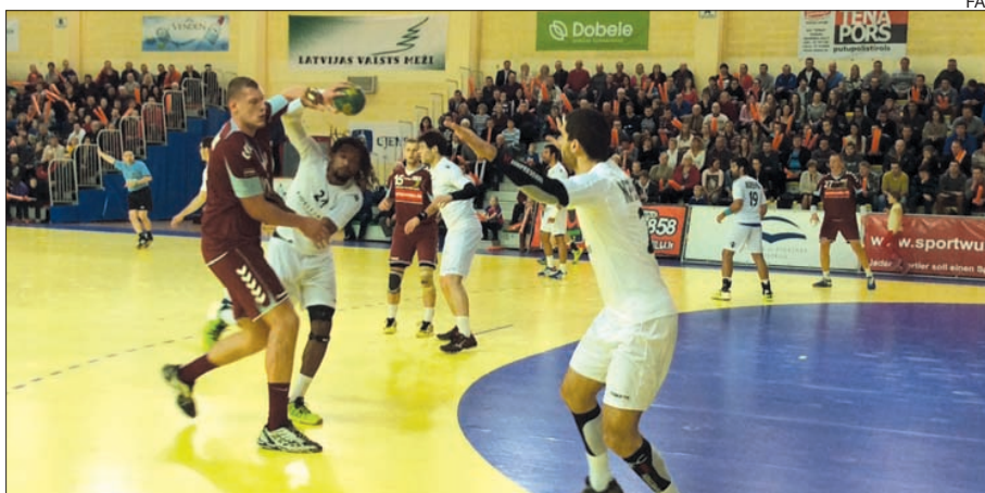
Portugal bateu-se com um adversário fisicamente muito forte

Portugal conseguiu vencer ontem na Letónia, por 26-24, mas o resultado não impede que falhe a qualificação para os "play-offs" de acesso ao Mundial de andebol de 2015, com a Bósnia-Herzegovina a vencer o grupo 5.