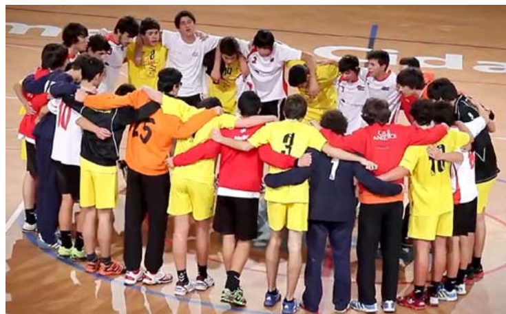
Evento decorreu no pavilhão municipal do Entroncamento