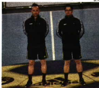
Martins formam a única dupla de irmãos