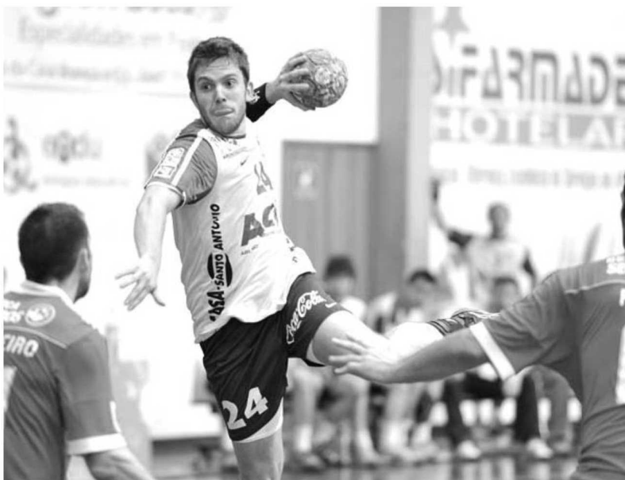
O Madeira SAD sentiu muitas dificuldades para superar o Benfica, que ganhou com justiça.