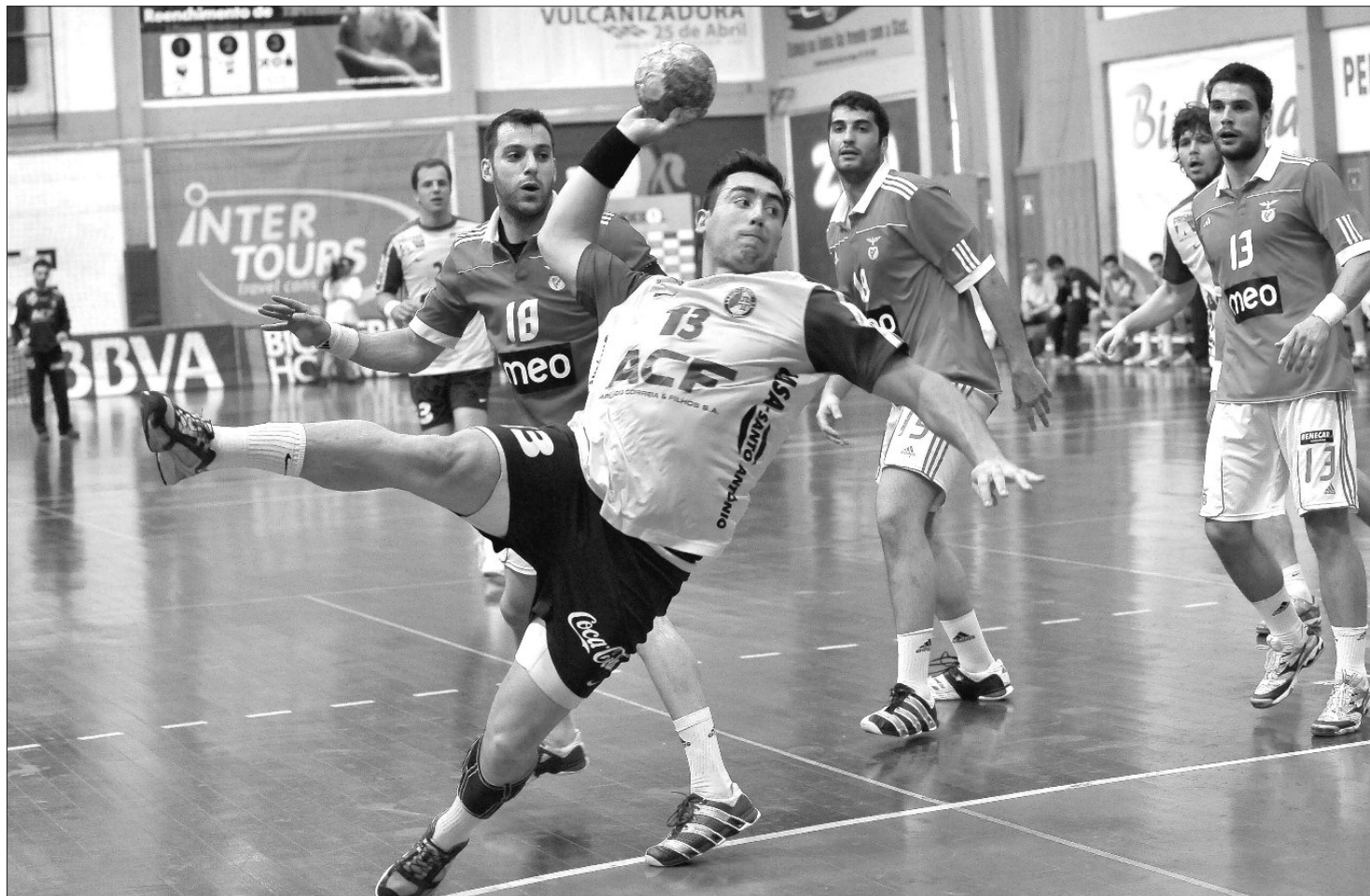
“Sociedade” insular somou o primeiro desaire nesta fase final, após o empate com o Águas Santas e as vitórias sobre ABC de Braga e Sporting.