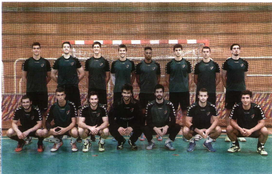
Seleção Nacional viaja hoje de manhã com destino a Uberlândia

A Seleção Nacional de juniores aterra hoje no Brasil onde disputará o Campeonato Mundial de Andebol sub-21. O primeiro jogo é já amanhã, às 22h30, contra a seleção da Roménia