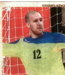
Guardião esloveno reforça equipa leonina