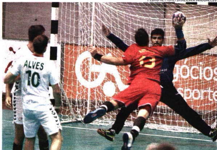
Portugal enfrentou a poderosa Espanha na terceira ronda do Mundial de juniores