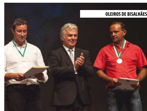
OLEIROS DE BISALHÃES