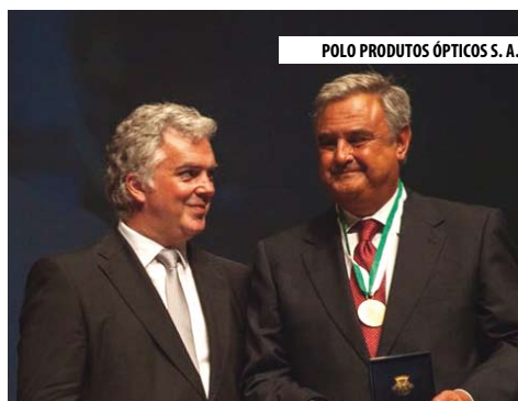
POLO PRODUTOS ÓPTICOS S. A.