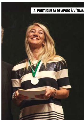
A. PORTUGUESA DE APOIO À VÍTIMA