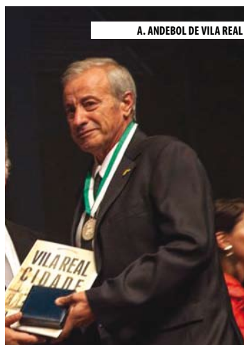
A. ANDEBOL DE VILA REAL