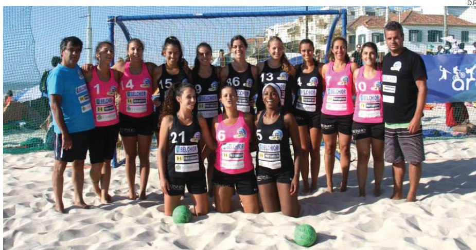
100 Ondas voltam a repetir a presença na fase final nacional em andebol de praia

Com estes resultados, são nove as equipas do circuito lei-