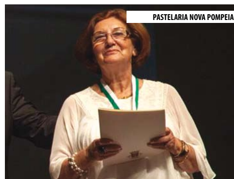
PASTELARIA NOVA POMPEIA