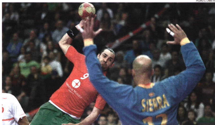
Portugal não conseguiu contrariar o favoritismo dos campeões do Mundo e do guarda-redes Jose Manuel Sierra

Ontem, os campeões do Mundo demonstraram na segunda parte porque conquistaram o Mundial: a equipa defende como ninguém e transforma as falhas contrárias em golos. Logo no reinício, o 12-14 tornou-se em 15-20 com 11 minutos jogados naquele que foi o pior período