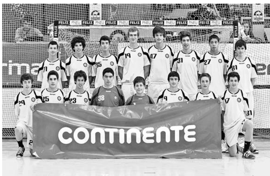
Equipa de iniciados do ABC discutem até domingo o título de campeão nacional

À partida a turma bracarense depara-se com dois jogos de dificuldade acrescida, ao deparar-se com dois sérios candidatos ao título. A equipa do Águas Santas é mesmo a actual detentora do título. Mas estes jovens do ABC "estão preparados" para as dificuldades, tendo em linha de conta o percurso realizado até esta final. Depois do título regional, alcançaram o primeiro lugar na segunda fase, à frente do Águas Santas, o que garantiu o apuramento para a fase final.