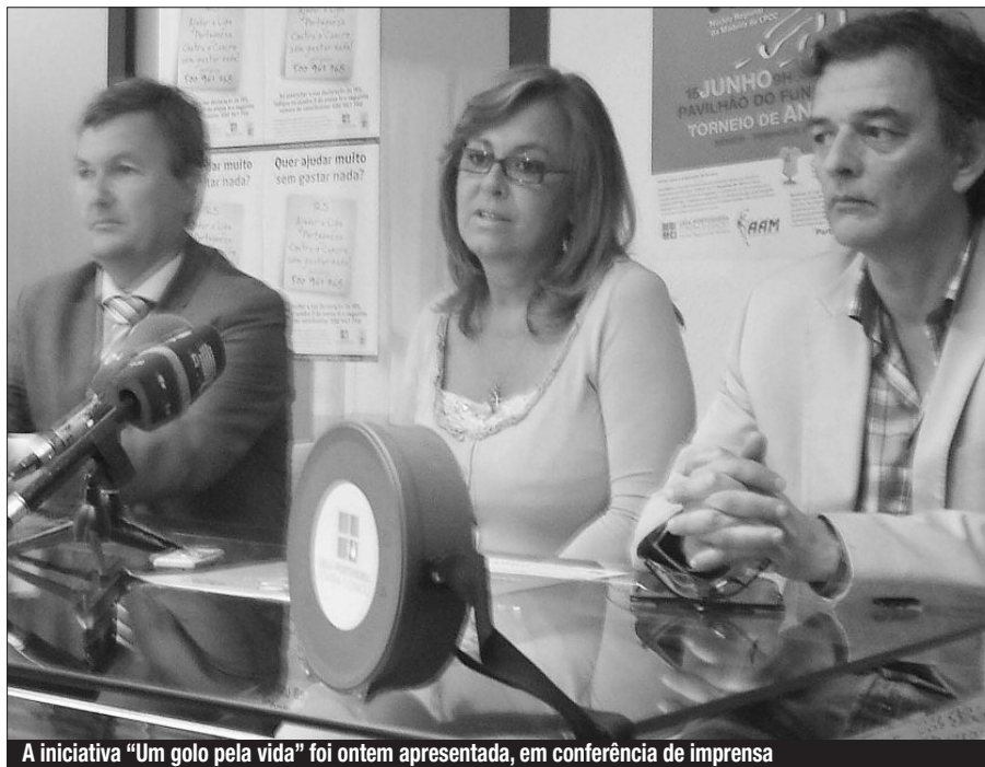
A iniciativa "Um golo pela vida" foi ontem apresentada, em conferência de imprensa

■ PARCERIA ENTRE A LIGA PORTUGUESA E A ASSOCIAÇÃO DE ANDEBOL