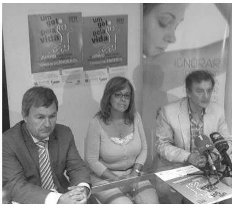
Quarta edição do torneio solidário de andebol foi ontem apresentado.

A entrega do donativo será feito durante a tarde deste sábado, por altura da Gala dos Campeões da época 2012/2013 da Associação de Andebol da Madeira. Esta cerimónia acontece entre as 17h15 e as 19 horas e será um momento de homenagear os que mais se destacaram ao longo da temporada, bem como o reconhecimento de uma época desportiva onde a Associação de Andebol da Madeira, juntamente com os seus clubes associados, conseguiu concretizar tudo o que estava previsto em termos de plano de actividades. P. V. L.