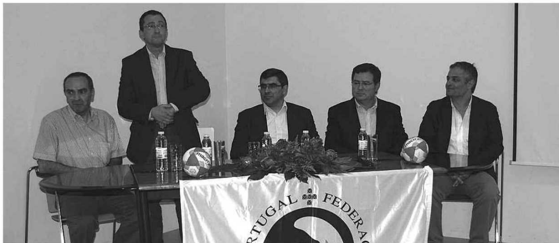
A mesa que apresentou esta fase final

A Didáxis, Cooperativa de Ensino de Riba d'Ave, vai receber, no próximo fim de semana, dias 8 e 9 de junho, as seleções de Aveiro, Braga, Leiria e Madeira, no Torneio Regional Feminino. Esta fase final é uma organização conjunta da Federação Portuguesa de Andebol, Associação de Andebol de Braga, município de Famalicão e Didáxis.