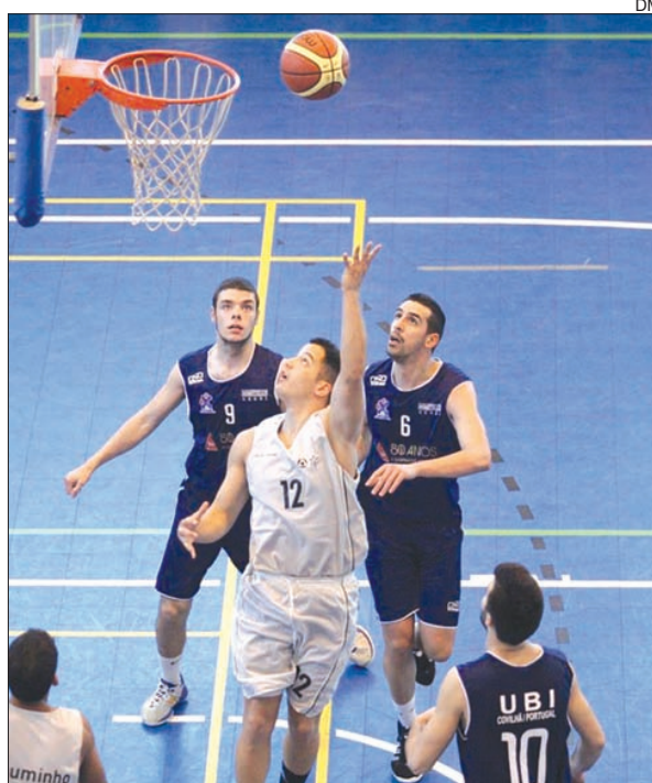
Basquetebol da UM em ação

A competição segue hoje para o terceiro dia, com futebol, andebol e basquetebol).