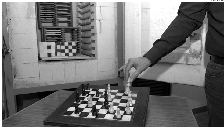
Neste momento, estão empenhados na construção de tabuleiros de xadrez em cerâmica