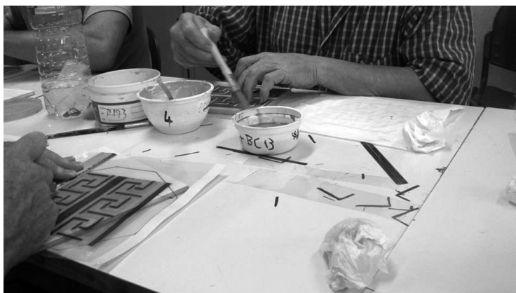
Reclusos fizeram 80 réplicas de azulejos, destinados à fachada de um edifício histórico de Aveiro