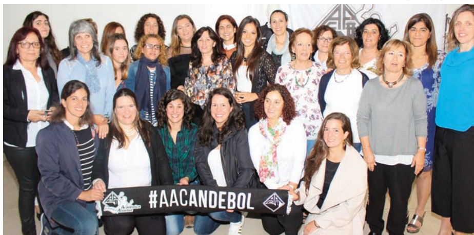
Antigas atletas da equipa feminina académica marcaram presença na festa da Secção

O jantar acabou por permitir uma troca de experiências entre gerações, recordaram-se