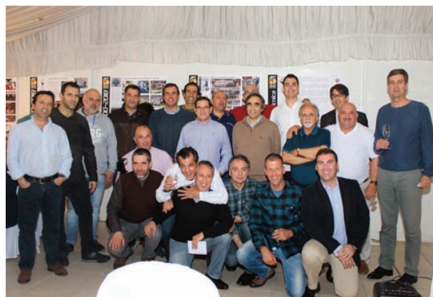
80 anos celebrados por antigos andebolistas da Académica

Actualmente, com sete escalões em actividade, juntando cerca de 120 atletas, o andebol da AAC tem objectivos bem definidos, como é a aposta no reforço dos escalões de formação, bem como a ambição de que a equipa sénior volte ao Nacional da 2.ª Divisão, o qual disputou esta temporada, sendo que não