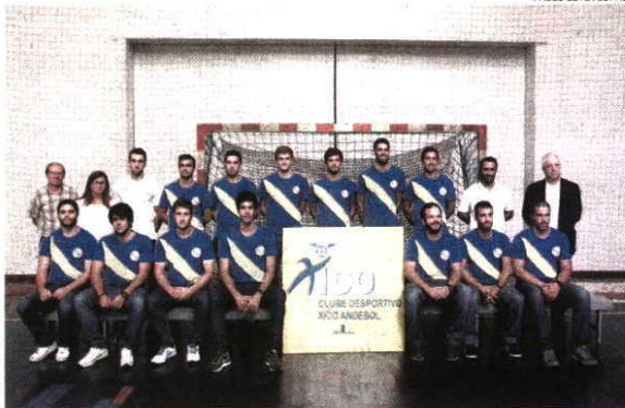
Xico Andebol tem o sonho de ficar nos oito primeiros lugares da classificação