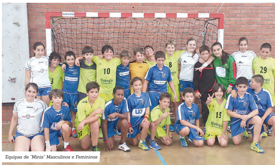
Equipas de “Minis” Masculinos e Femininos

gada, com mais pessoas, para que daqui a 3-4 anos, consigamos ter uma equipa sénior. Na nova época vamos começar com juniores. “O CAPV está a crescer, sem pressas, mas os resultados vão aparecendo”. Atualmente o clube conta com 6 escalões: Minis Masculinos, Minis Femininos, Infantis, Iniciados, Juvenis e Juniores.