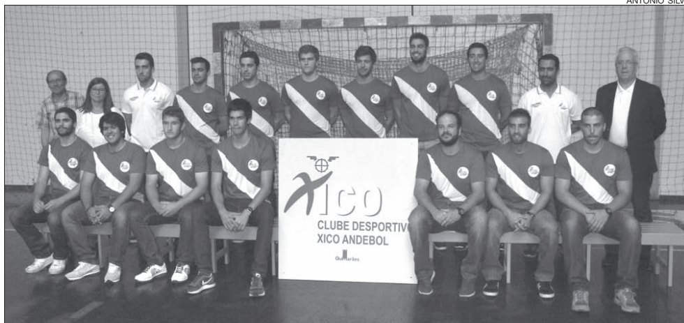
Plantel do Xico Andebol para 2014/15