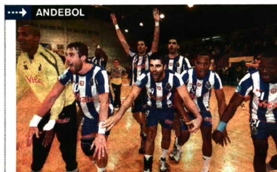
RECORRENTE. Plantel festeja conquista do tricampeonato

CONTINUIDADE DE OBRADOVIC AO NÍVEL DE RESENDE