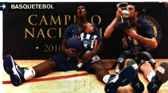
ALCANÇADO. O título que faltava comemorar no Dragão Caixa