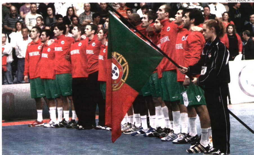
Um triunfo nesta última fase chega para que Portugal regresse aos grandes palcos internacionais, no caso o Europeu de 2012

Polónia-PORTUGAL 13.45 h (RTP2) Hala Arena, em Poznan, na Polónia