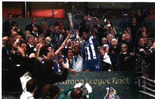
APOTEOSE. Sucesso em Dublin tornou a época portista grandiosa

Para acabar como começou, o FC Porto venceu a Taça de Portugal, num jogo de loucos, repetindo o