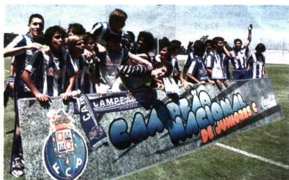
PROMESSAS. Grupo dos Sub-15 augura tornada de alta qualidade