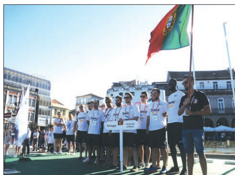
A seleção de andebol da Universidade do Minho