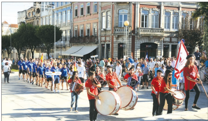
O momento em que as seleções chegaram à Avenida Central