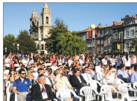
Os elementos da organização, convidados e seleções