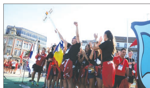
A boa disposição da seleção da Roménia