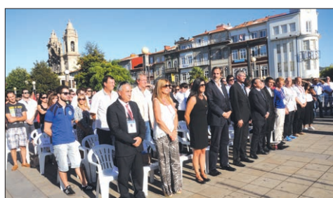
O momento em que se ouvia o hino de Portugal