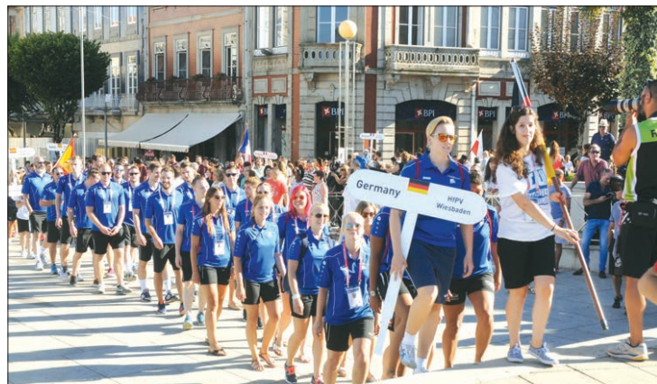
A equipa alemã com boa disposição