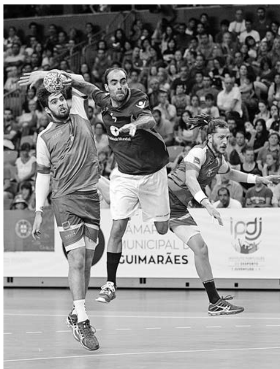
A equipa de andebol da UMinho é a actual campeã mundial universitária

Apesar dos muitos eventos desportivos internacionais organizados pela UMinho/AAUM (11º evento internacional e o 6º europeu), este é o primeiro europeu da modalidade organizado pelas duas instituições, desta forma e como afirmou o treina-